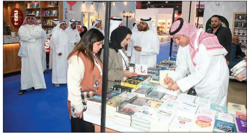
إقبال على إصدار أحمد الشحومي الجديد «لا تتوقف»