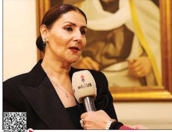
الشاعرة الشيخة أفراح مبارك الصباح متحدة خلال الحفل