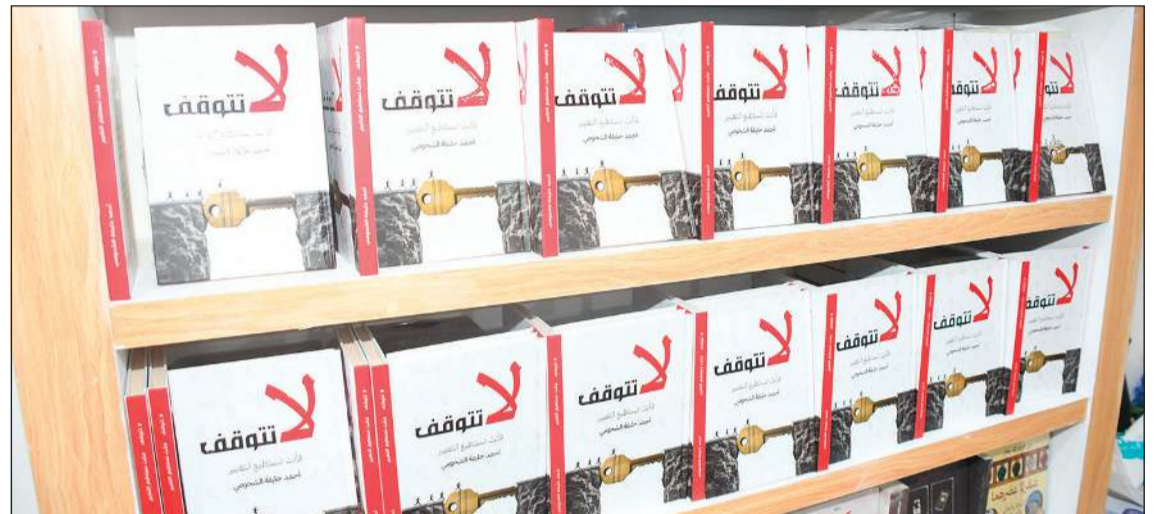
كتاب أحمد الشحومي «لا تتوقف».. فانت تستطيع التغيير، في معرض الكويت الدولي للكتاب