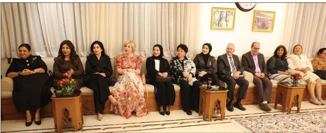
جانب من حضور الحفل

شارك بإصداره في معرض الكويت الدولي للكتاب الـ 48 وأكد أن التجربة الشخصية المحرك الأساسي لما يكتبه