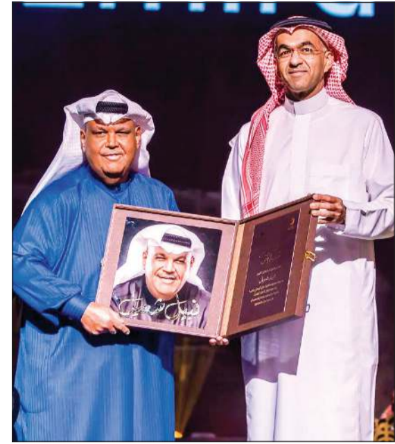
أحمد الحمادي مكرماً «نبض الكويت» نبيل شعيل

وقال: «اليوم احتفل بفنانين تاريخيين، صوت عذّب، حفظ وأعطى الكثير للفن الخليجي والعربي، ونفتخر بتكريمه في موسم الرياض، دائماً