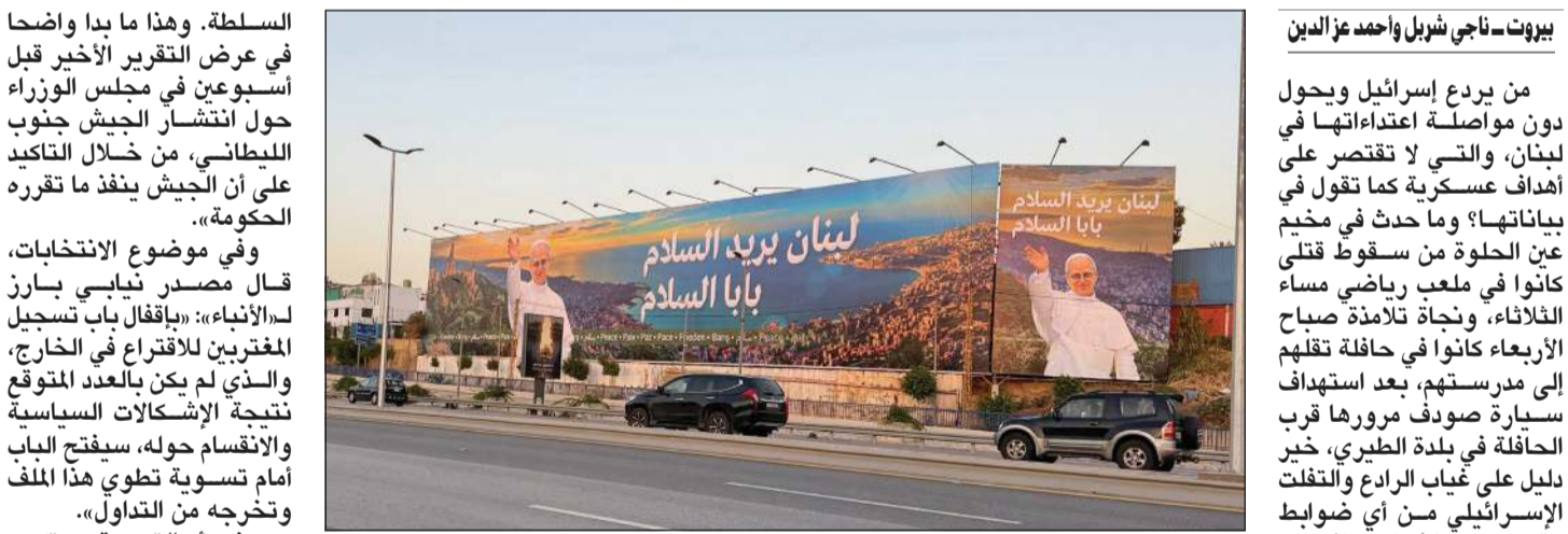
رفع صورة عملاقة لبابا الفاتيكان ليو الرابع عشر على التوسراند مطار بيروت

بالإجماع حتى في عز الحرب الأهلية «مؤسسة ووطنية أم»، ويطول الاستهداف تاليا القيادة السياسية للجبل، من دون أن يعني ذلك قطعا للتواصل بين رئاسة الجمهورية والسفارة الأميركية، إذ علمت «الأنباء» ان الرئيس جوزف عون سيبحث الأمر مع السفير الأمريكي ميشال عيسى قريبا. وفي السياق، قال مرجع سياسي لـ«الأنباء»: «الحملة لا تستهدف قائد الجيش بشخصه بل إن المقصود الحكومة والعهد تحديدا. الجيش ليس جزيرة منفصلة عن الواقع اللبناني، بل إن ما يقوم به هو ترجمة لإرادة حيوية عدة».