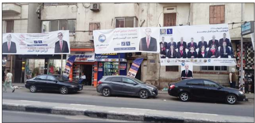
جانب من الدعاية الانتخابية في شوارع القاهرة

النواب، يحق له أن يتوجه إلى المقر الانتخابي داخل البلد الذي يتواجد به، وأن يبدي بصوته في العملية الانتخابية، طالما كان اسمه مقيدا في قاعدة بيانات الناخبين، وموطنه الانتخابي (محل الإقامة الثابت في بطاقة الرقم القومي) ضمن المحافظات الـ 13 التي ستشهد إجراء الانتخابات.