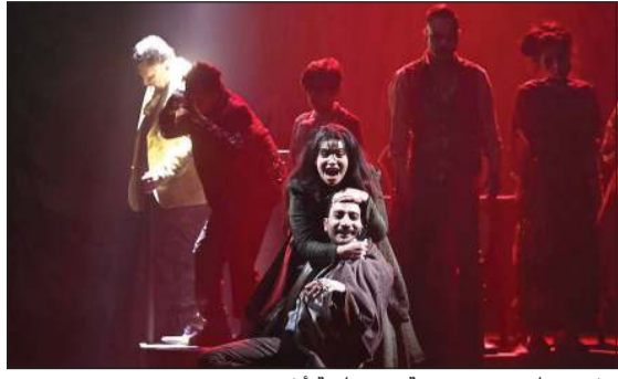
مشهد سابق من مسرحية «من زاوية أخرى»