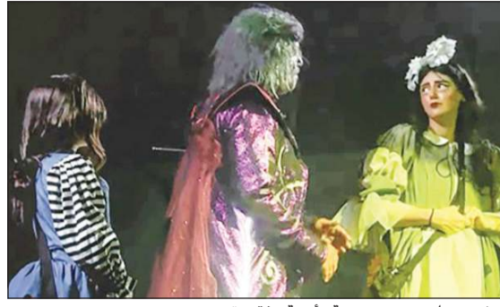
مشهد سابق من مسرحية «أمنية مفقودة»