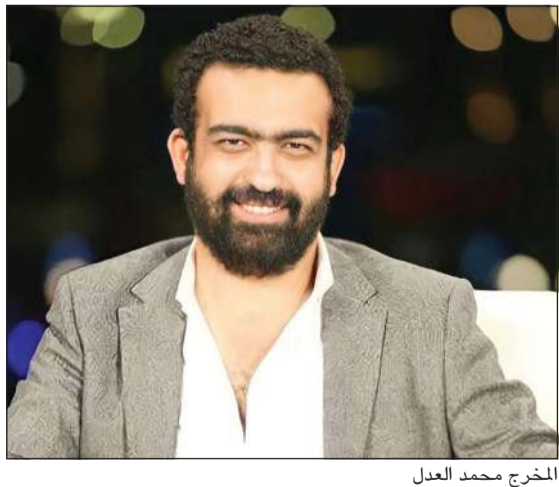
المخرج محمد العدل