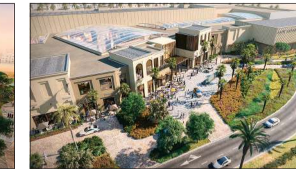
مشروع سوق صباح

حقق معدل إشغال بلغ 48٪ منذ بداية العام وحتى الربع الثالث من عام 2025، ولاتزال قاعة الاحتفالات في الفندق تشهد طلباً مرتفعاً لإقامة حفلات الزفاف والفعاليات الخاصة بالشركات. كما أن الفندق أيضاً يعد جزءاً من مبادرة Visit Kuwait لدعم كلاً من القطاعين السياحيين والفندقيين بكل السبل الممكنة والمساهمة في تعزيز السياحة في الكويت.