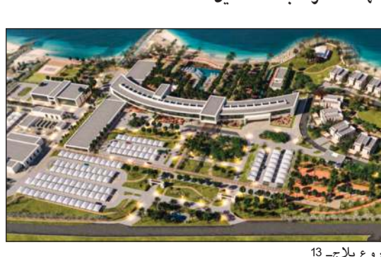
مشروع بلاج- 13

يتمتع فندق هيلتون جاردن إن-البحرين بموقع رائع متصل بالأقيوز-البحرين، وقد حافظ على أداء تشغيلي مستمر منذ اليوم الأول من افتتاحه، إلا أنه شهد انخفاضاً طفيفاً خلال هذا العام نتيجة لافتتاح عدة فنادق