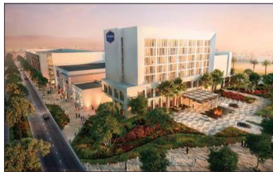
فندق هامبتون إن في سوق صباح

أما عن الأقيوز- الخبر، فقد بلغت نسبة الإنجاز الإجمالية للمجمع والبرج المتعدد الاستخدام 31٪ حتى تاريخه، ويضم المشروع مكاتب بمساحة إجمالية قابلة للتأجير تبلغ 16 ألف متر مربع، بالإضافة إلى فندق كانوبي من مجموعة هيلتون الذي يضم عدد 200 غرفة. ويتوقع استكمال الانتهاء من المشروع بحلول الربع الثالث من عام 2027.