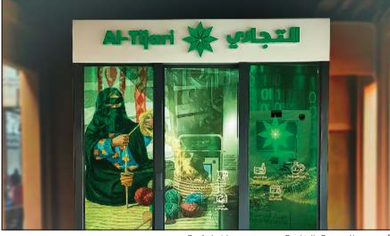
أجهزة الخدمة الذاتية في سوق المباركية

في إطار جهوده المستمرة لتطوير قنواته المصرفية وتوسيع نطاق خدماته الرقمية، أعلن البنك التجاري عن توفير أجهزة الخدمة الذاتية في سوق المباركية، ليتيح للعملاء تجربة مصرفية متقدمة وسهلة في واحدة من أكثر الوجهات التجارية حيوية في البلاد. وباتى هذا التوسع ضمن استراتيجية البنك الهادفة إلى تعزيز انتشار الخدمات