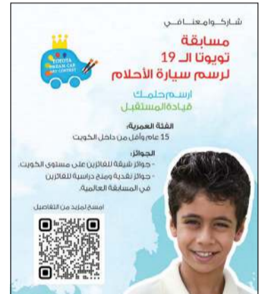
شارك وانجانباً في مسابقة 19 تويوتا الأحلام، والتي تدعو الأطفال في الكويت إلى إبراز مواهبهم الفنية وخيالهم الواسع.

انطلاق النسخة التاسعة عشرة من مسابقة تويوتا لرسم سيارة الأحلام، والتي تدعو الأطفال في الكويت إلى إبراز مواهبهم الفنية وخيالهم الواسع. تهدف هذه المسابقة إلى تشجيع الأطفال حول العالم على الحلم والتخيل والإبداع من خلال أعمال فنية تعبر عن مفهوم التعلل في المستقبل، فمنذ عام 2004 ألهمت تويوتا ما يقارب 10 ملايين طفل من 151 دولة لإطلاق العنان لخيلتهم والإستمتاع برسم أحلامهم، وتسهم هذه المسابقة في تنمية إبداع الجيل القادم من المبتكرين والمفكرين والحائزين لصنع مستقبل أفضل.