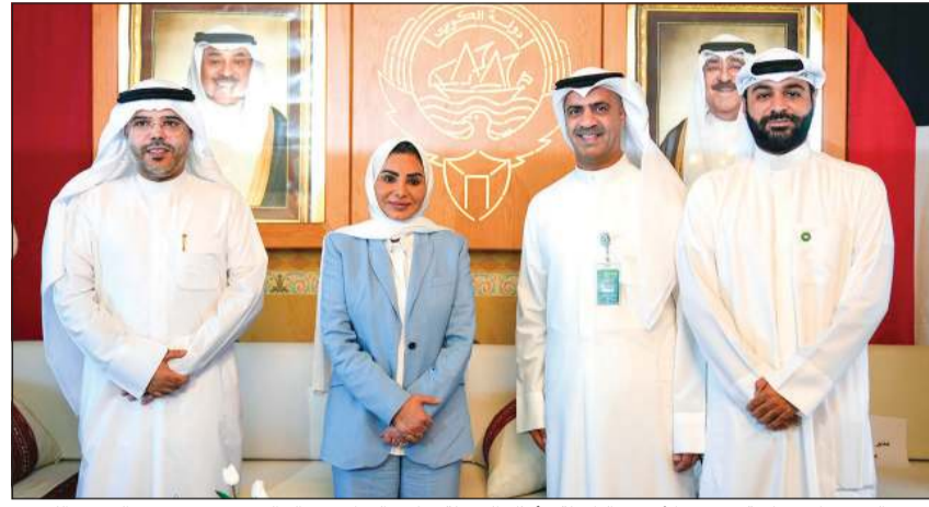
وزيرة الشؤون الاجتماعية وشؤون الأسرة والطفولة د. أمثال الخويلة وكيل الوزارة د. خالد العجمي مع وفد بيت التمويل الكويتي

أشادت وزيرة الشؤون الاجتماعية وشؤون الأسرة والطفولة د. أمثال الخويلة بدور بيت التمويل الكويتي واهتمامه بالبيئة والحفاظ عليها، متمنية الدور المحوري والمهم الذي يقوم به البنك في المسؤولية الاجتماعية والاستدامة. وتمنت الخويلة المشاركة القيمة لبيت التمويل الكويتي في الحملة الوطنية «هذا دورك» لتجديد وتحضير وتشجير الكويت، مؤكدة خلال لقاء مع وفد من بيت التمويل الكويتي أن الحملة تعبر عن اهتمام الدولة بالبيئة، وتشجيع المشاريع والمبادرات التي تدعم هذا التوجه، وتعتبر مشاركة بيت التمويل الكويتي نموذجاً لما يجب أن يكون عليه القطاع الخاص من وعي ومساندة وتقدير لأهمية جهود المحافظة على البيئة. ويشترك بيت التمويل الكويتي في الحملة الوطنية «هذا دورك» التي انطلقت فعالياتهما في 2 نوفمبر وتستمر حتى 3 ديسمبر المقبل، بالتعاون مع وزارة الشؤون وبمشاركة واسعة من الجهات الحكومية والخاصة والفرق التطوعية، بهدف