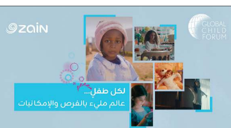
للكل طفل... عالم مليء بالفرص والإمكانيات