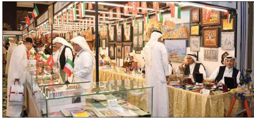
الثراء الكويتي حاضر في معرض الكتاب عبر فريق «إكسبو 965»