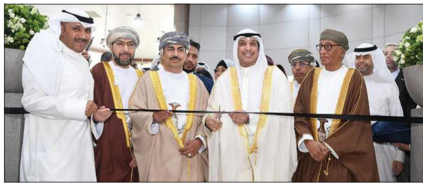
وزير الإعلام والثقافة ووزير الدولة لشؤون الشباب عبدالرحمن المطيري ووزير الإعلام العماني د.عبدالله الحراسي والسفير العماني د.صالح الخروصي والمستشار المتقاعد لسلطان عمان محمد بن الزبير ومدير المعرض خليفة الرباح خلال افتتاح معرض الكتاب