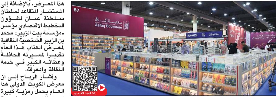
آلاف الكتب التي يزخر بها معرض الكتاب في دورته الـ 48 (قاسم باشا)