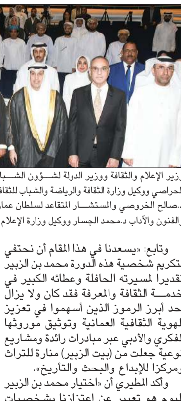
وزير الإعلام والثقافة ووزير الدولة لشؤون الشباب عبدالرحمن المطيري ووزير الإعلام العماني د.عبدالله الحراسي والسفير العماني د.صالح الخروصي والمستشار المتقاعد لسلطان عمان محمد بن الزبير والأمين العام للمجلس الوطني للثقافة والفنون والآداب د.عبدالله الحراسي والسفير العماني د.صالح الخروصي والمستشار المتقاعد لسلطان عمان محمد بن الزبير ومدير المعرض خليفة الرباح خلال افتتاح معرض الكتاب (أحمد علي)

افتتح وزير الإعلام والثقافة ووزير الدولة لشؤون الشباب عبدالرحمن المطيري مساء أمس الأول فعاليات معرض الكويت الدولي الـ 48 للكتاب تحت رعاية سمو الشيخ أحمد العبدالله رئيس مجلس الوزراء، ويستمر حتى 29 الجاري. وشهد حفل الافتتاح الذي أقيم في مركز الشيخ جابر الأحمد الثقافي تكريم شخصية الدورة الحالية من المعرض وعنوانها «وطن الكتاب.. عاصمة الثقافة» المستشار المتقاعد لسلطان سلطنة عمان لشؤون التخطيط الاقتصادي مؤسس «مؤسسة بيت الزبير» محمد بن الزبير تقديراً لمسيرته الحافلة وعطائه الكبير في خدمة الثقافة والمعرفة. وقال الوزير المطيري في كلمة خلال حفل الافتتاح: «يشرفني ويسعدني أن أقف بيمينك اليوم مثلاً عن سمو الشيخ أحمد العبدالله رئيس مجلس الوزراء راعي هذا الحدث الثقافي الكبير لافتتاح الدورة الثامنة والأربعين من معرض الكويت الدولي للكتاب». وتابع أن «هذه التظاهرة تمثل عنواناً راسخاً للتراث الثقافي في دولتنا الغالية وتجسد ارتباط الإنسان الكويتي بالعلم والمعرفة والفكر منذ نشأة الدولة الحديثة».