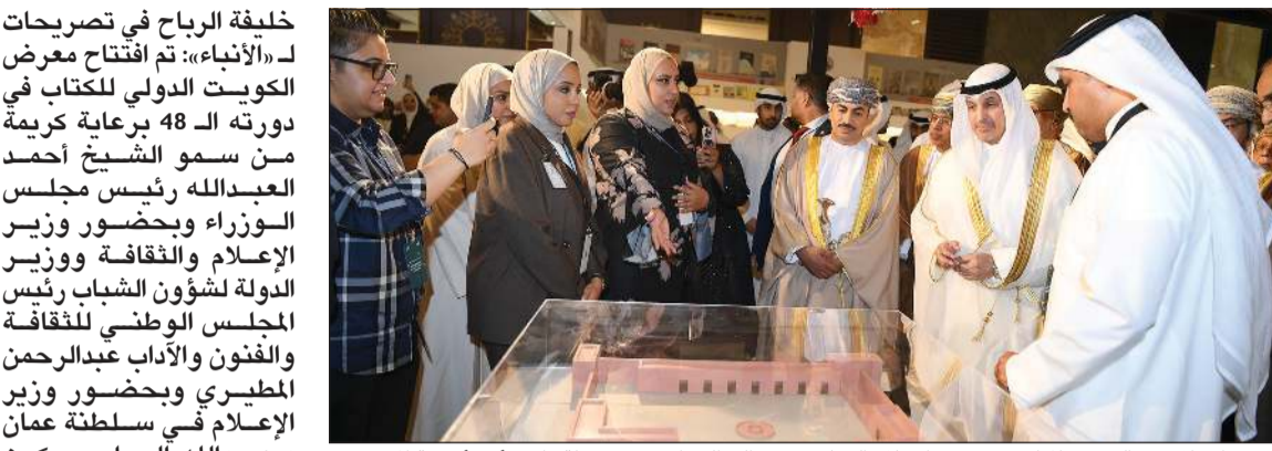
وزير الإعلام عبدالرحمن المطيري ووزير الإعلام العماني د.عبدالله الحراسي في جولة داخل أحد أجنحة المعرض

33 دولة شاركت في المعرض بـ 433 جناحاً و611 مشاركاً وأكثر من 287 ألف عنوان