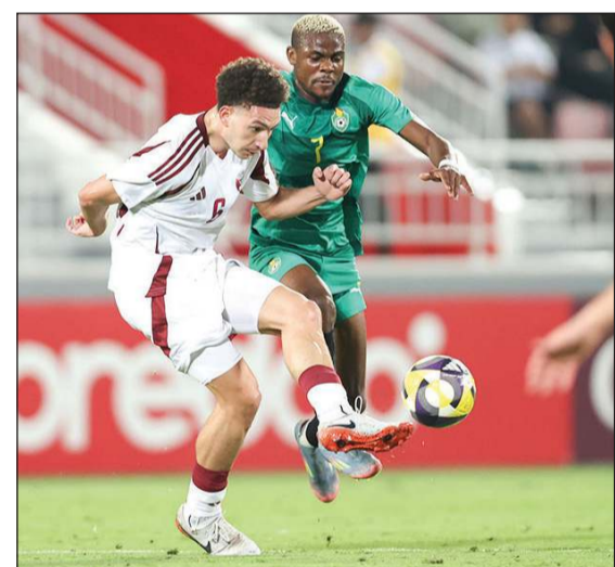
جانب من ودية «العنابي» وزيمبابوي

الملحق الآسيوي، في خطوة تاريخية تؤكد طموحات الكرة القطرية في تحقيق حضور مميز على الساحة العالمية. ومن المقرر أن يعود المنتخب القطري لاستئناف تحضيراته بعد انتهاء الجولة العاشرة من الدوري القطري ومشاركة اللاعبين في دوري أبطال آسيا، استعداداً لانطلاق بطولة كأس العرب. إلى ذلك، يستعد الفنان المصري الكبير محمد منير ل طرح أغنية جديدة خاصة ببطولة كأس العرب، وذلك بعد الانتهاء من تسجيل الأغنية في أحد الاستديوهات الكبرى خلال الأسابيع الماضية، حيث حرص منير على أن تعكس الأغنية طابعاً عربياً يحمل روح الحماس الرياضي والتآزر بين الشعوب العربية. ومن المنتظر أن يتواجد منير في الدوحة قبل انطلاق البطولة للمشاركة في حفل الافتتاح، حيث سيقدم الأغنية رسمياً لأول مرة أمام الجماهير.