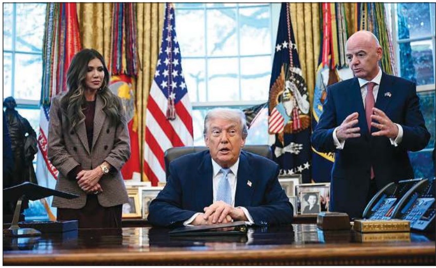
دونالد ترامب متحدثاً للصحافيين بحضور جيانى إنفانتينو وكريستى نوبم

سفر آمن ومنظم. وقالت مبيعات تذاكر مباريات كأس العالم الأسبوع الماضي، حيث تستعد الولايات المتحدة لاستضافة 78 مباراة من أصل 104 مباريات في البطولة. كما سيتم إجراء قرعة نهائيات كأس العالم في مركز كينيدى الثقافي بالعاصمة الأمريكية واشنطن، وذلك في الخامس من ديسمبر المقبل.