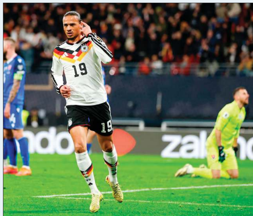
ليروي ساني سجل هدفين في مرمى سلوفاكيا

الدوحة - فريد عبدالباقى خسر المنتخب القطري لكرة القدم أمام ضيفه منتخب زيمبابوي 2-1 في المباراة الودية التي أقيمت على ستاد عبدالله بن خليفة ببنادي الدحيل، في إطار استعدادات المنتخب القطري للمشاركة في نهائيات كأس العرب التي تستضيفها الدوحة خلال الفترة من 1 إلى 18 ديسمبر المقبل، وأيضاً التحضير لمونديال 2026 في الولايات المتحدة والمكسيك وكندا. وشهدت المواجهة استبعاد عدد كبير من اللاعبين الأساسيين، وهم: المعز علي، أكرم عفيف، إدميلسون جونيور، بيدرو ميغيل، بوعلام خوي، كريم بوضياف، وعبدالعزيز حاتم، بهدف إراحتهم ومنح الفرصة أمام الجهاز الفني للمحليين في ودية ثنائية جمعت الفريقين بعد فوز «الفراعة» في المواجهة الأولى الإسباني لمنتخب قطر جولين