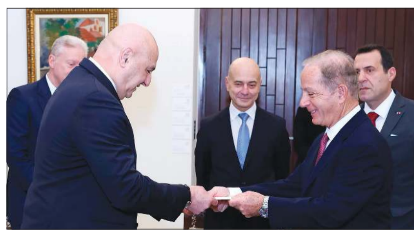
رئيس الجمهورية العماد جوزف عون يتسلم أوراق اعتماد السفير الأميركي الجديد ميشال عيسى (محمود الطويل)

وأحزاب أخرى. وفي الجانب الاقتصادي، يعقد اليوم وغداً مؤتمر «بيروت 1» تحت عنوان «بيروت تنهض من جديد»، بحضور صاحب الرعاية رئيس الجمهورية العماد جوزف عون، وبمشاركة وفود من الصناديق العربية والأوروبية واستثمارية من الخليج وأوروبا وأميركا ورواد من مختلف القطاعات للمساهمة في رسم مستقبل لبنان وبناء مرحلة جديدة من النهوض والتنمية، وذلك في الواجهة البحرية لبيروت.