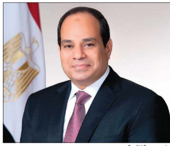
الرئيس عبدالفتاح السيسي

يأتي أعضاء مجلس النواب ممثلين فعليين عن شعب مصر تحت قبة البرلمان، ولا تتردد الهيئة الوطنية للانتخابات في اتخاذ القرار الصحيح عند تعذر الوصول إلى إرادة الناخبين الحقيقية سواء بالإلغاء الكامل لهذه المرحلة من الانتخابات، أو إلغائها جزئياً في دائرة أو أكثر من دائرة انتخابية، على أن تجري الانتخابات الخاصة بها لاحقاً. كما طالب الرئيس السيسي الهيئة الوطنية للانتخابات بالإعلان عن الإجراءات المتخذة نحو ما وصل إليها من مخالفت في الدعاية الانتخابية، حتى هذه الدعاية، ولا تخرج عن إطارها القانوني، ولا تتكرر في الجولات الانتخابية الباقية.