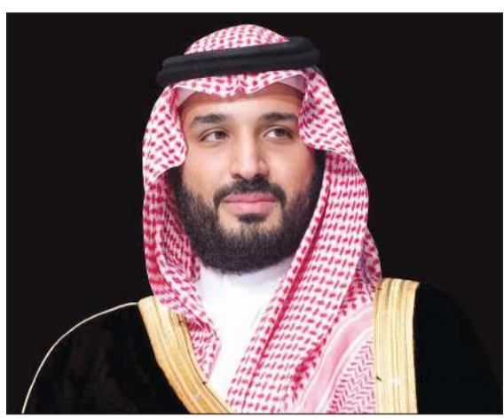
صاحب السمو الملكي الأمير محمد بن سلمان ولي العهد رئيس مجلس الوزراء السعودي