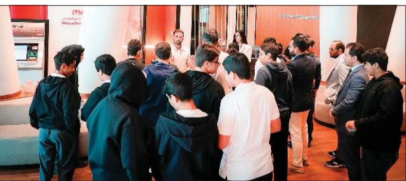
الطلاب في زيارة لفرع بنك الخليج ببرج الكريستال

التوعية الشاملة بحقوق النعمان بآمان، لضمان سلامة المعاملات وتعزيز الشمول المالي والاستقرار النقدي والاقتصادي، عبر