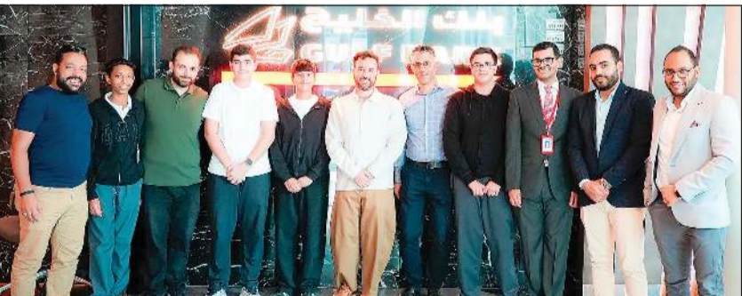
صورة جماعية لطلاب ومدرسي المركز مع فريق بنك الخليج