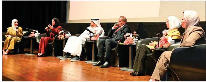
جانب من الحلقة النقاشية

أعلنت «زين» الكويت عن رعايتها مؤتمر «صوتك مرآة إنسانيتك» للقضاء على العنف اللفظي ضد المرأة، الذي أقيم في مركز الشيخ جابر الأحمد الثقافي بالتزامن مع اليوم الدولي للقضاء على العنف ضد المرأة، وذلك برعاية وزير الشؤون الاجتماعية وشؤون الأسرة والطفولة ورئيس المجلس الأعلى لشؤون الأسرة د.أمثال الحوييلة.