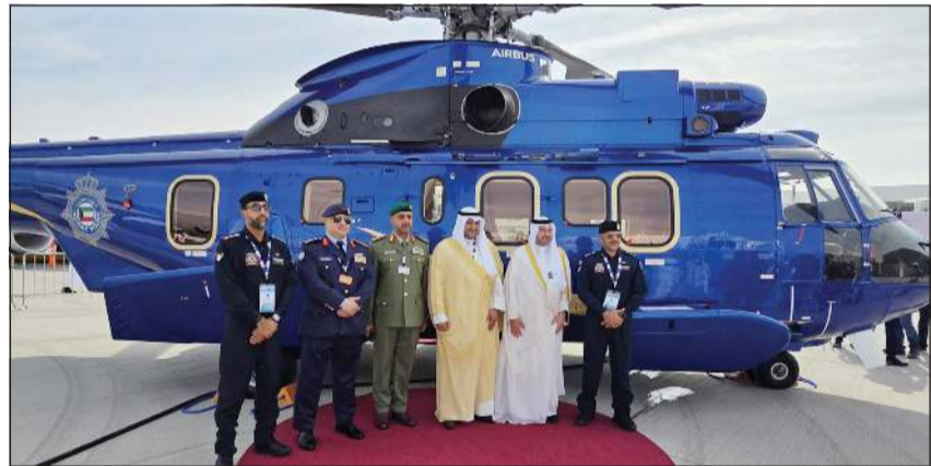
وكيل وزارة الدفاع الشيخ د.عبدالله المشعل ورئيس الهيئة العامة للطيران المدني الشيخ حمود المبارك خلال زيارة جناح وزارة الداخلية في المعرض والاطلاع على الطائرة العمودية المخصصة للمهام الأمنية

دبي - كونا: أكد رئيس الهيئة العامة للطيران المدني الشيخ حمود المبارك أن مشاركة دولة الكويت في معرض دبي للطيران 2025، تشكّل محطة مهمة لإبراز تقدم قطاع الطيران وتعزيز حضوره على الساحة الإقليمية والدولية.