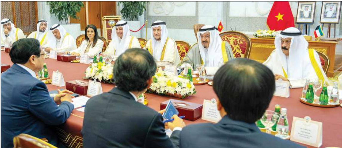
رئيس الوزراء سمو الشيخ أحمد العبدالله خلال جلسة المباحثات الرسمية مع رئيس وزراء فيتنام قام مينه تشينه والوفد المرافق له بحضور نائب رئيس مجلس الوزراء وزير الدولة لشؤون مجلس الوزراء شريدة المعوشجي ورئيس ديوان رئيس مجلس الوزراء وزير الإعلام والثقافة وزير الدولة للشؤون الشباب عبدالرحمن المطيري ووزيرة الأشغال العامة د.نورة المشعان ووزير النفط طارق الرومي والمستشار بديوان رئيس مجلس الوزراء رئيس بعثة الشرف المرافقة الشيخ د.باصل الصباح والرئيس التنفيذي لمؤسسة البترول الكويتية الشيخ نواف السعوي