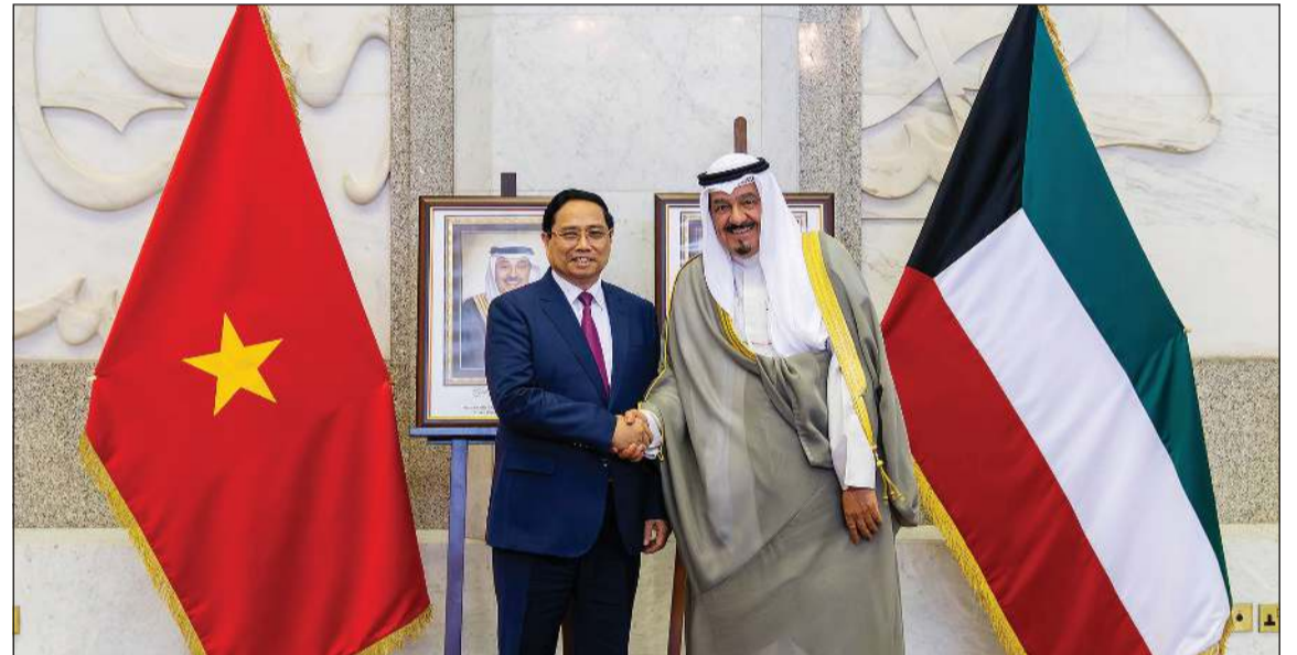
سمو الشيخ أحمد العبدالله رئيس مجلس الوزراء مع رئيس وزراء فيتنام قام مينه تشينه