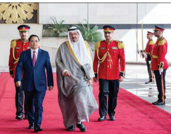
رئيس الوزراء سمو الشيخ أحمد العبدالله خلال مراسم استقبال رئيس وزراء فيتنام قام مينه تشينه

الحيا ووقعهما عن الجانب الفيتنامي وزير الخارجية لي هواي ترونغ. وقد أقام سمو رئيس مجلس الوزراء مأدبة غداء رسمية على شرف رئيس وزراء جمهورية فيتنام الاشتراكية الصديقة والوفد المرافق له. وكان سمو الشيخ أحمد العبدالله رئيس مجلس الوزراء استقبل في قصر بيان رئيس وزراء جمهورية فيتنام الاشتراكية الصديقة قام مينه تشينه والوفد المرافق له. وقد جرت للضيف مراسم استقبال رسمية عزف خلالها النشيدان الوطني الكويتي والجمهوري الفيتنامي قام بعدها بمصافحة كبار مستقبليهم وفي مقدمتهم النائب الأول لرئيس مجلس الوزراء ووزير الداخلية الشيخ فهد اليوسف ونائب