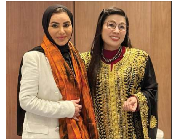
وزيرة الشؤون الاجتماعية د. أمثال الحويلة أهدت عقيلة رئيس الوزراء الفيتنامي الثوب الكويتي التقليدي

لمكافحة الجريمة وحماية المجتمع وترسيخ الاستقرار في البلدين الصديقين. وأعرب الوفد الفيتنامي وفق البيان عن تقديره لحسن الاستقبال وما لبسه من اهتمام وتعاون. مؤكدا تطلعه إلى فتح آفاق أوسع للعمل الأمني المشترك في المستقبل. وتأتي هذه المباحثات ضمن الزيارة الرسمية التي يقوم بها رئيس وزراء جمهورية فيتنام الاشتراكية الصديقة قام مينه تشينه والوفد المرافق له للبلاد.