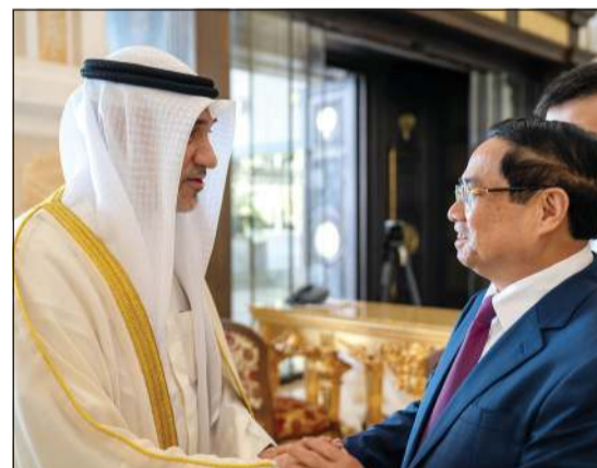
النائب الأول لرئيس مجلس الوزراء وزير الداخلية الشيخ فهد اليوسف مستقبلا رئيس وزراء فيتنام

الإعفاء من التأشيرات لحاملي جوازات السفر الدبلوماسية والرسمية بين حكومي الكويت وجمهورية فيتنام الاشتراكية. كما وقع الجانبان مذكرة تفاهم بين معهد سعود الناصر