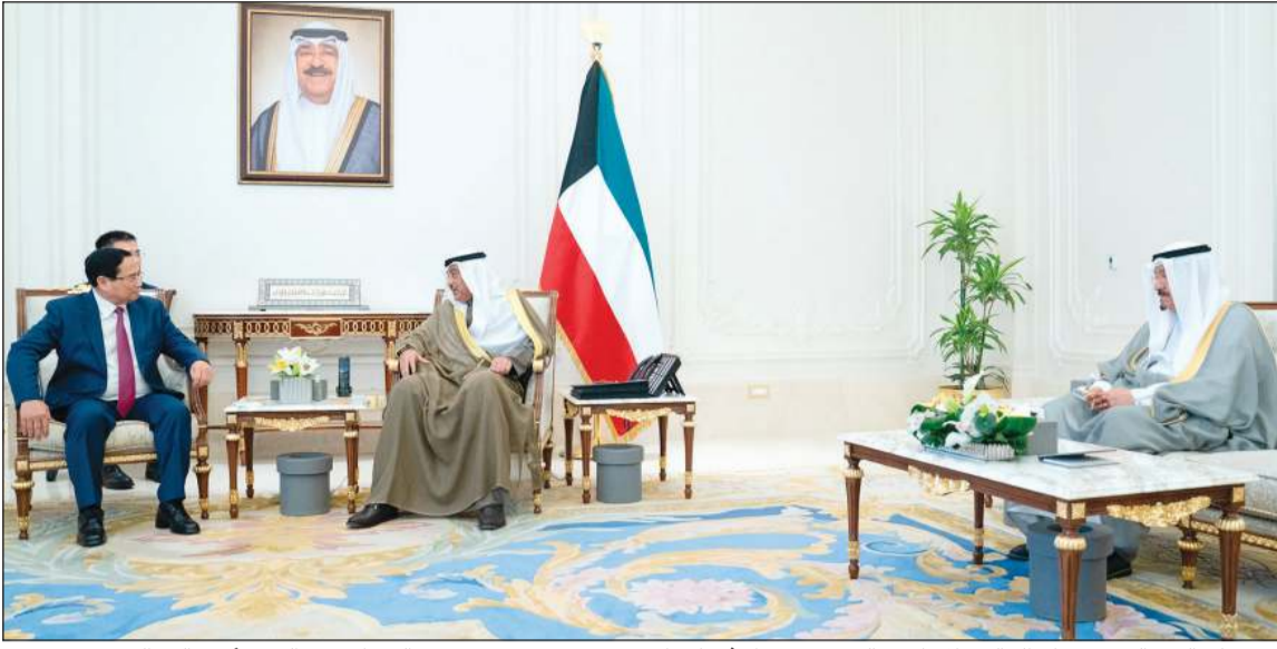
سمو ولي العهد الشيخ صباح الخالد خلال استقباله رئيس وزراء فيتنام قام مينه تشينه بحضور رئيس الوزراء سمو الشيخ أحمد العبدالله