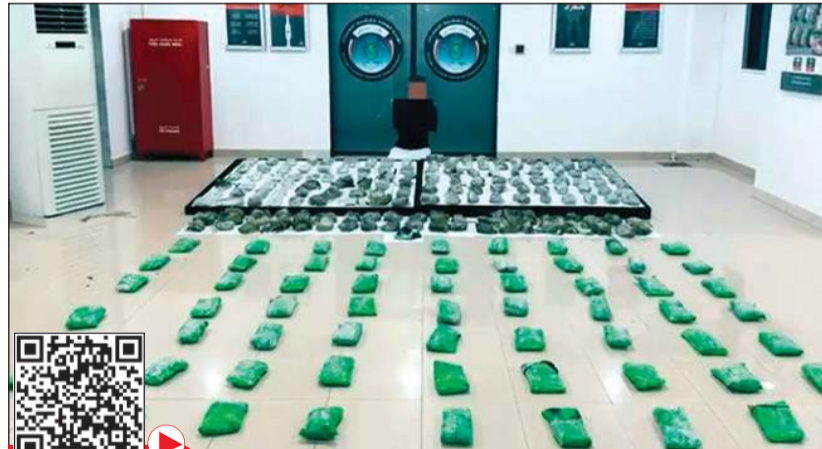
المتهم وأمامه المضبوطات من المواد المخدرة المهربة

تمكنت الإدارة العامة لمكافحة المخدرات من إحباط أكثر من 100 كيلو حشيش وماريفوانا مخبأة داخل مركبة مشحونة في عبارة مائية. وقالت وزارة الداخلية في بيان لها إن معلومات وردت إلى الإدارة العامة لمكافحة المخدرات بقيام أحد المواطنين بالسفر إلى الجمهورية الإسلامية الإيرانية عبر مركبته الخاصة باستخدام العبارة المائية من ميناء الشويخ البحري، بقصد جلب مواد مخدرة وإخفاؤها داخل المركبة بطريقة سرية ومحكمة. وأشارت «الداخلية» إلى أنه تم تشكيل فريق ميداني مختص لجمع الاستدلالات التي أكدت صحة وجديّة المعلومات، وتم التنسيق الفوري مع الإدارة العامة للمجمعات، حيث تم