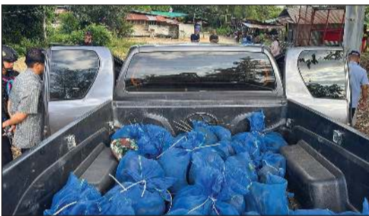
مجموعة من قرد المكاف محبزة في أكياس زرقاء تم إنقاذها من شبكة اتجار بالحيوانات في تايلند

باتنوك - أ.ف.ب: أوقف رجال كانا ينقلان 81 قرد مكاف بسيارة في تايلند بالقرب من الحدود مع كمبوديا، بحسب ما أعلنت القوات المحلية التي تشبه في تنظيمها عملية واسعة النطاق لانتجار حيوانات برية. وأوقفت دورية السيارة بعد ظهر الجمعة في مقاطعة سا كايو شرق البلد وعُثرت على الحيوانات داخل أكياس زرقاء، فضلاً عن الميثامفيتامين. وجاء في منشور على «فيسبوك» للوحدة 12 من قوات حرس الغابات التي تتولى الإشراف على المنطقة الحدودية «أوقفت السلطات شخصين للاشتباه بضلوعهما» في العملية. وأقر الرجلان خلال استجوابهما بالمشاركة في شبكة اتجار عابرة للحدود تنقل قردة المكاف من تايلند إلى كمبوديا، بحسب القوات المسلحة.