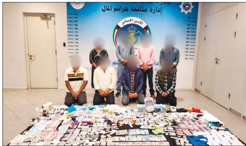
المتهمون الـ 8 وأمامهم الأدوية المسروقة

تمكن قطاع شؤون مديريات الأمن بالتعاون مع قطاع شؤون الأمن الجنائي، وبناء على توجيهات النائب الأول لرئيس مجلس الوزراء ووزير الداخلية الشيخ فهد اليوسف، من ضبط تشكيل عصابي مكون من 8 أشخاص يمارسون الطب دون ترخيص ويتاجرون بالأدوية الحكومية خارج الأطر القانونية. وجاءت عملية الضبط بعد رصد نشاط مخالف يندرج داخل مسكن بمنطقة الفروانية يستغل كعيادة وهمية لمزاولة مهنة الطب وبيع الأدوية دون ترخيص. وأسفرت الجهود عن ضبط أربعة متهمين من الجنسية الهندية، ثبت تورط أحدهم في ممارسة مهنة الطب، فيما كان الثلاثة الآخرون يتربصون على العيادة للحصول على العلاج. وقال بيان صادر عن وزارة الداخلية إن التحريات كشفت عن شبكة أخرى مرتبطة