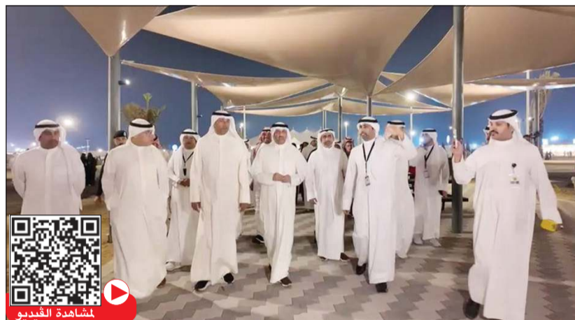
محافظ مبارك الكبير وحولي بالتكليف الشيخ صباح بدر السالم ووكيل وزارة الداخلية اللواء علي العدواني وقيادات من الوزارة في افتتاح المخيم

عمل متكامل شاركت فيه قطاعات الوزارة المختلفة، بما يضمن بيئة آمنة وممتعة للعائلات ويعكس الصورة الحضارية لوزارة الداخلية في الاهتمام بمنتسبيها. من جانبه، أوضح رئيس مجلس إدارة نادي ضباط الشرطة العميد عبدالحسين العكشان أن تطوير النادي جاء بدعم القيادة العليا لتوسيع نطاق الاستفادة من خدماته ليشمل جميع الضباط وضباط الصف والأفراد والمدنيين العاملين في الوزارة، مؤكداً أن المخيم يساهم في تعزيز روح الانتماء والتواصل الاجتماعي. ويفتح المخيم أبوابه يومياً من الساعة 8 صباحاً حتى منتصف الليل، موفراً للمنتسبين وأسرههم فرصة الاستفادة من جميع الأنشطة والخدمات في بيئة آمنة وممتعة.