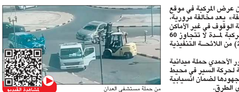
من حملة مستشفى العदान

أكدت الإدارة العامة للمرور أن عرض المركبة في موقع غير مخصص للبيع «على الأرصفة» يعد مخالفة مرورية، ويعرض صاحبها لتحريم مخالفة الوقوف في غير الأماكن المخصصة، إضافة إلى حجز المركبة لمدة لا تتجاوز 60 يوماً، استناداً إلى المادة (207) من اللائحة التنفيذية لقانون المرور. من جهة أخرى، نفذ رجال مرور الأحمدية حملة ميدانية لتابع المركبات المخالفة والمعيقة لحركة السير في محيط مستشفى العदान، وذلك في إطار جهودها لضمان انسيابية الحركة المرورية وسلامة مراداي الطرق.