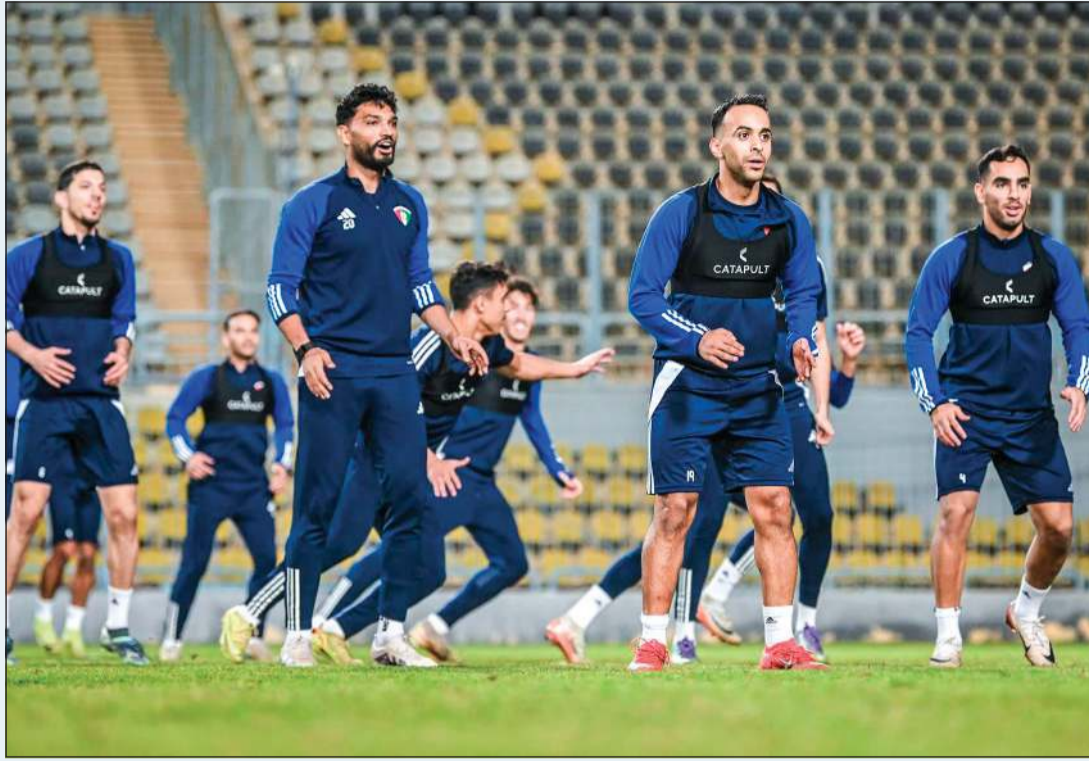
جانب من تدريبات منتخبنا الوطني تحضيراً لمهمة القبلية

منتخب تنزانيا. ومن المقرر ان يخضع لاعبو المنتخب إلى جلسة استشفاء تسبقها محاضرة فنية للمدرب البرتغالي هيليو سوزا حول أداء المنتخب أمام منتخب تنزانيا متضمناً السليبات والإيجابيات. وبحسب برنامج معسكر الأزرق سيلعب منتخبنا مباراته الودية الثانية بعد غد الثلاثاء أمام منتخب غامبيا، وهي المحطة الأخيرة للمنتخب قبل توجهه إلى قطر للاستعداد لملاقاة