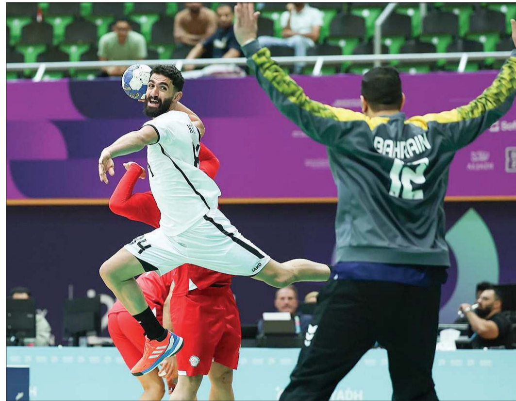
منتخبنا الوطني لكرة اليد لم يحالفه الحظ أمام البحرين