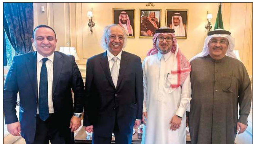
السفير السعودي لدى لبنان د.وليد بخاري خلال استقباله الشيخ محمد الجراح وعدنان آل إسماعيل ود.وسام فتوح بمقر السفارة السعودية

■ العماد جوزف عون: «المؤتمر المصرفي العربي» رسالة أمل للبنانيين وثقة متجددة بمكانة لبنان ■ محمد الجراح: الكويت ملتزمة دائماً بدعم جهود تعزيز التكامل الاقتصادي والمصرفي العربي