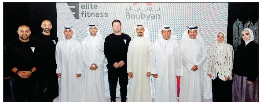
لقطة جماعية لقيادات «بوبيان» و«نادي إيليت»