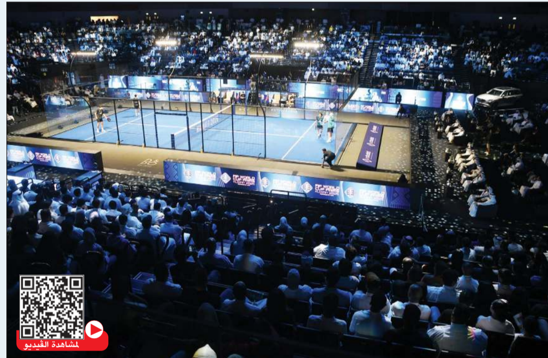
حضور جماهيري غفير لاهم بطولات الاتحاد الدولي للبادل في عام 2025