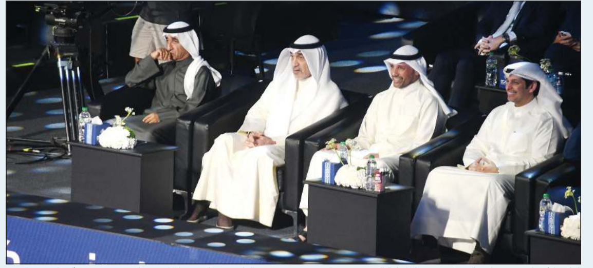
النائب الأول لرئيس مجلس الوزراء ووزير الداخلية الشيخ فهد اليوسف ومرزوق الغانم وعبدالرحمن المطيري والشيخ سعيد آل مكتوم يتابعون نهائي كأس العالم للبادل