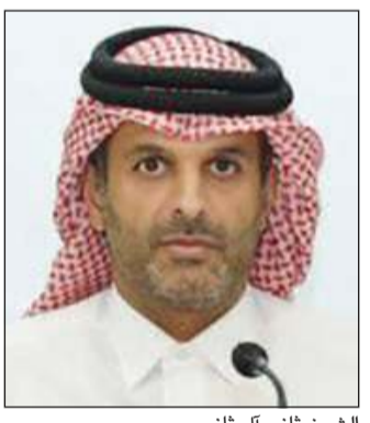
الشيخ ثاني آل ثاني