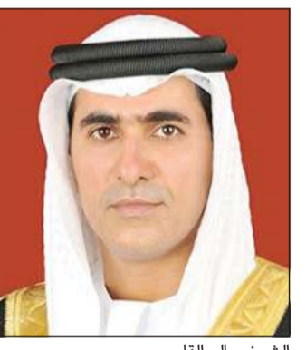
الشيخ سالم القاسمي