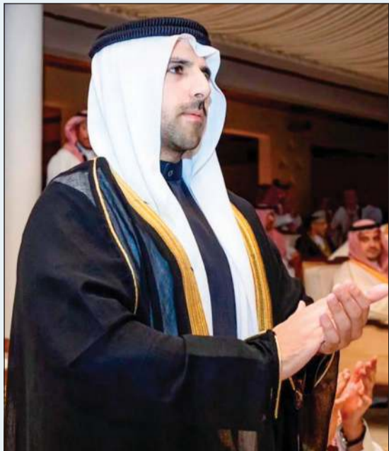
رئيس اللجنة الأولمبية الشيخ فهد الناصر