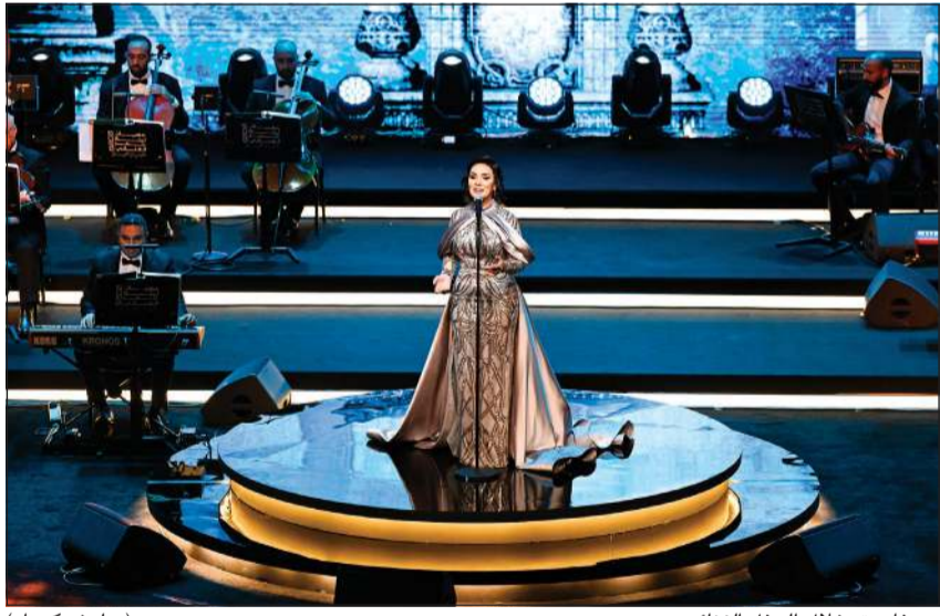
مي فاروق خلال الحفل الغنائي (ريليش كوما)

أحيت المطربة المصرية مي فاروق مساء أول من أمس حفلاً غنائياً في المسرح الوطني بمركز الشيخ جابر الأحمد الثقافي، ضمن حفلات مهرجان «ليلة عمر 2025»، حيث قدمت مختارات مميزة من أبرز أعمالها الغنائية التي تلاقى تجاوبا كبيرا من الجمهور، بجانب مجموعة من أغاني الطرب الأصيل لكبار المطربين مثل أم كلثوم ومحمد عبد الوهاب ووردة وفروز وعبدالحليم حافظ وجورج وسوف وآخرين، بتوزيع حديث، بصاحبة فرقة موسيقية بقيادة المايسترو تامر فيظلي، ورفع الحفل شعار «كامل العدد»، حيث استوعب المسرح السعة الكاملة للجمهور.