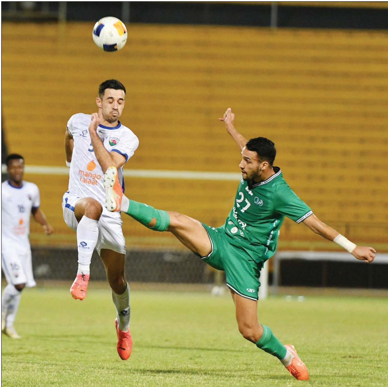
العربي ظهر بشكل جيد أمام الجماهير

فعل السالمية كل شيء في مباراته مع الشباب