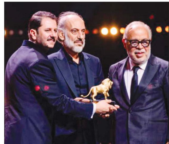
غسان مسعود أثناء تكريمه في المهرجان

أعرب الفنان غسان مسعود عن سعادته بالمشاركة في أنشطة الدورة الثالثة عشرة من مهرجان وهران الدولي للفيلم العربي الذي يحتفي بالإبداع العربي، مؤكداً أن المهرجان أصبح منصة تجمع صناعات السينما من مختلف الدول العربية، وتسلط الضوء على تجارب فنية وإنسانية ملهمة. وكرم مهرجان «وهران الدولي للفيلم العربي» غسان مسعود تقديراً لمسيرته الفنية الحافلة بالأعمال المميزة في السينما والمسرح والتلفزيون، والتي جعلته أحد أبرز الوجوه العربية التي وصلت إلى العالمية من خلال مشاركته في أفلام