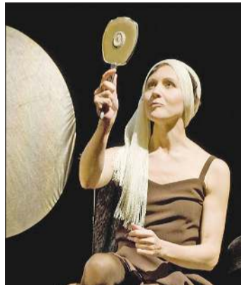
الفنانة الليتوانية نجمة فن المونودراما بيروتي مار