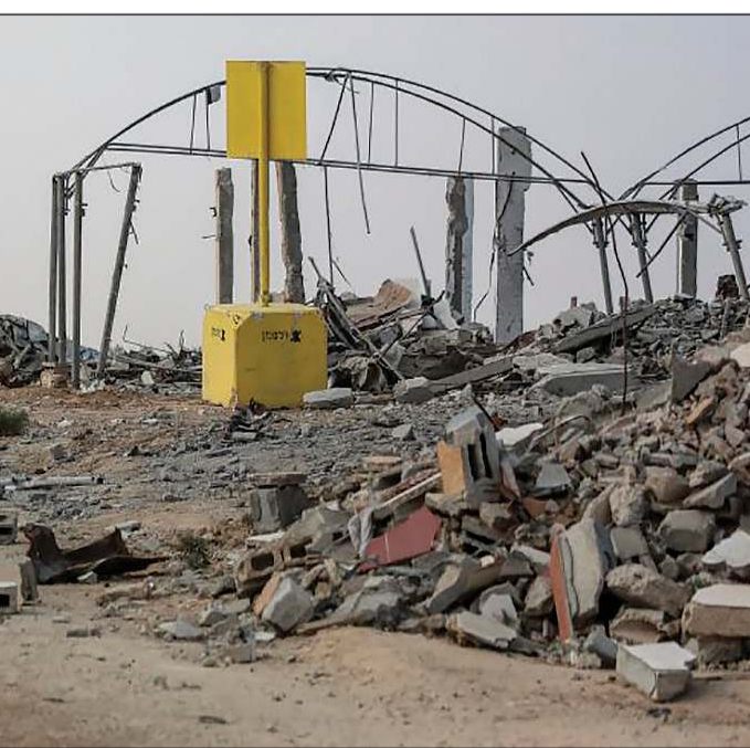
كتلة خرسانية تشير إلى «الخط الأصفر» الذي رسمه الجيش الإسرائيلي في مخيم البريج

عواصم - وكالات: بدأت الولايات المتحدة تحركاً في مجلس الأمن الدولي لإصدار قرار بتشكيل قوة دولية بصلاحيات واسعة في غزة بموجب خطة الرئيس دونالد ترامب لمرحلة ما بعد الحرب في القطاع، وفق ما نقل موقع اكسيوس الأميركي. وينقل الموقع عن مسودة قرار أميركي أن الولايات المتحدة أرسلت لعدد من أعضاء مجلس الأمن الدولي مسودة قرار يهدف إلى إنشاء قوة دولية في غزة. وكشف تقرير الموقع أمس، عن أن مشروع القرار الأميركي يتضمن نزع سلاح حركة المقاومة الإسلامية (حماس) إذا لم تسلمه طوعاً، وإرسال قوة استقرار وليس قوات حفظ سلام، بغزة لمدة سنتين. وبحسب المقترح، فإن واشنطن تهدف إلى نشر القوات الأولى في غزة بحلول يناير المقبل. كما أشار المقترح إلى أن قوة الاستقرار ستعمل على حفظ الأمن على حدود غزة مع مصر، وحماية الممرات الإنسانية بالقطاع، وتدريب الشرطة الفلسطينية. وفي سياق متصل، قال الأمين العام للأمم المتحدة أنطونيو غوتيريش إن مجلس الأمن يناقش مسودة مشروع القرار التي قدمتها الولايات المتحدة بشأن القوة المزمع نشرها في غزة، مضيفاً أن أي قوة ستنتشر في القطاع يجب أن تحظى بتقويض من الأمم المتحدة. وتابع: نشارك بنشاط من أجل التأكد من زيادة المساعدات المقدمة إلى سكان قطاع غزة،