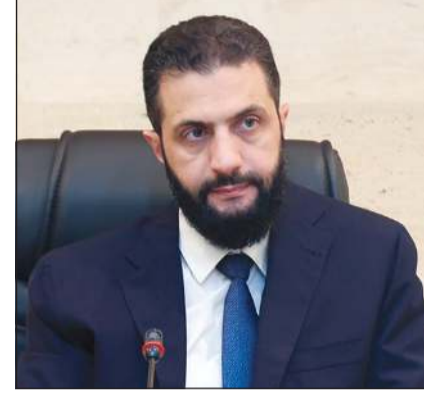
الرئيس السوري أحمد الشرع