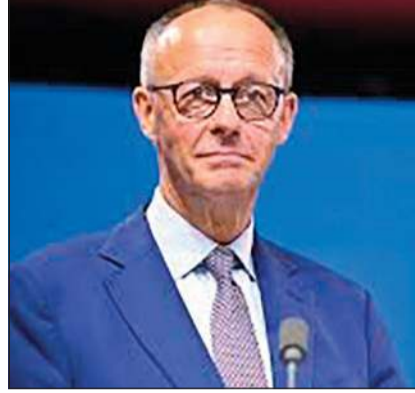
المستشار الألماني فريدريش ميرتس

وكالات: عقد الرئيس السوري أحمد الشرع سلسلة اجتماعات أمنية وتنموية لبحث ترسيخ الأمن ومتابعة تنفيذ الاستثمارات التي أعلن عنها في سورية مؤخراً. وقال وكالة الأنباء السورية «سانا» أن الشرع عقد أمس اجتماعاً مع وزير الداخلية أنس خطاط وعدد من مديري الإدارات في الوزارة.