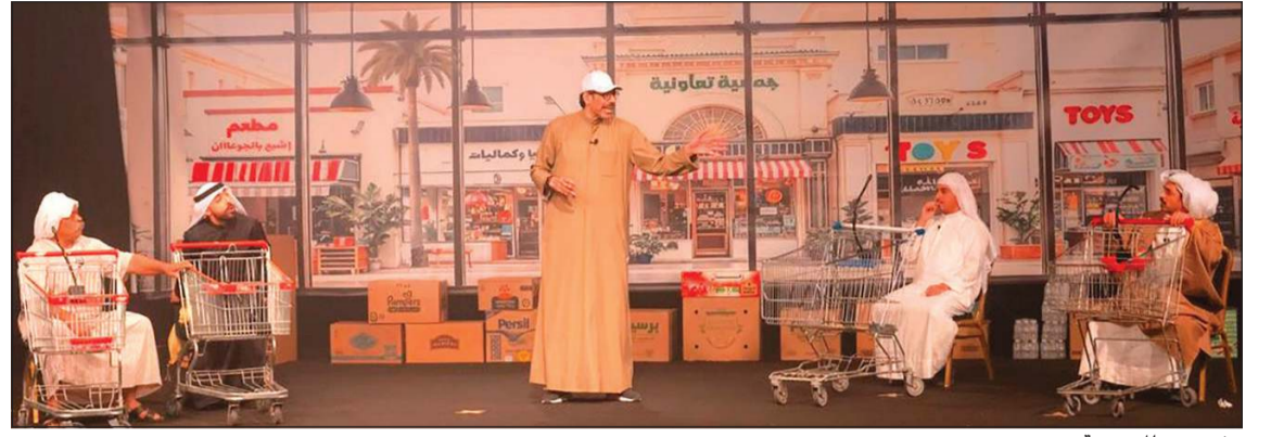
مشهد من المسرحية