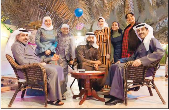
من كواليس مسلسل «حياة لا تشبهني»