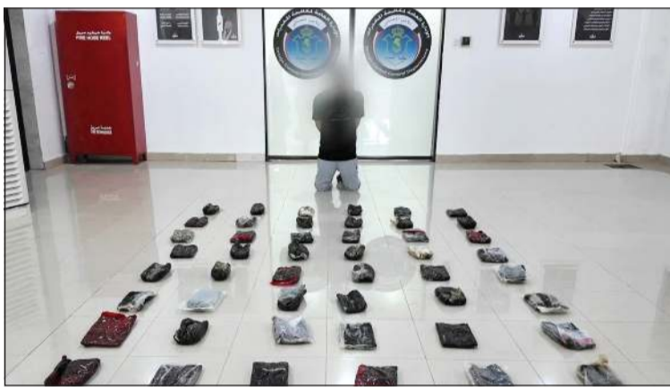
المتهم وأمامه الحشيش المضبوط

تمكنت الإدارة العامة لتنفيذ الأحكام - ممثلة في إدارة التنفيذ الجنائي - وبالتنسيق مع الإدارة العامة لمكافحة المخدرات، من ضبط كمية كبيرة من مادة الحشيش المخدرة تقدر بنحو 50 كيلوغراما في منطقة الفحيحيل. وكشفت الإدارة العامة للعلاقات والإعلام الأمني عن أن تفاصيل الواقعة تعود إلى ورود معلومات سرية دقيقة إلى إدارة التنفيذ الجنائي، أفادت بقيام أحد الأشخاص بالاتجار بالمواد المخدرة والاحتفاظ بكميات كبيرة منها تمهيدا لترويجها داخل البلاد، وعلى ضوء ذلك، تم التنسيق الفوري مع الإدارة العامة لمكافحة المخدرات، وتشكيل فريق أمني مشترك للبحث والتحري.