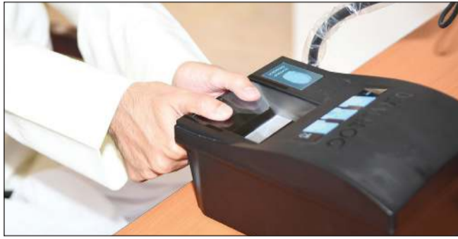
وقف إجراء البصمة البيومترية بالمنافذ للمغادرين

(الجوية والبرية والبحرية). وبينت أن الخطوة جاءت بعد ملاحظة تزايد أعداد المسافرين الذين لم يستكملوا إجراء البصمة مسبقاً، ما تسبب في ازدحام وتأخير في إجراءات المغادرة. ودعت وزارة الداخلية جميع المواطنين والمقيمين إلى مراجعة المراكز المخصصة للبصمة البيومترية قبل موعد السفر بوقت كاف، لإتمام العملية وتجنب أي عوائق أو تأخير أثناء السفر.