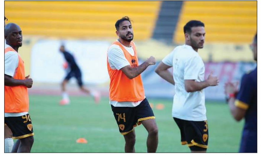
لاعب القادسية في تدريب سابق