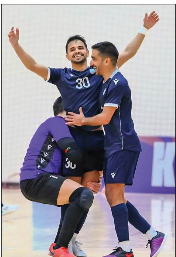
فريق كرة الصالات باليرموك يبحث عن إنجاز جديد