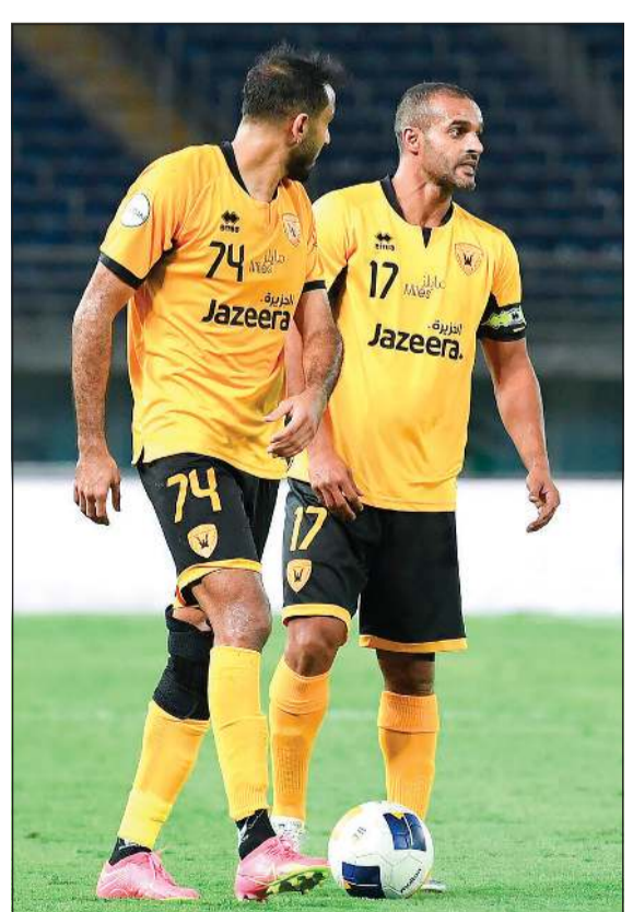
«الأصفر» يتطلع إلى مصالحة جماهيره اليوم