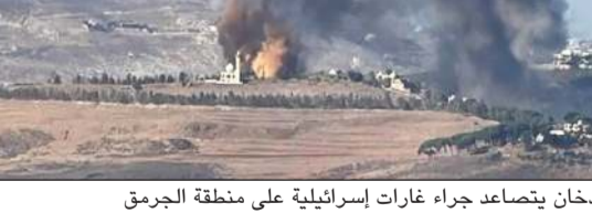
دخان يتصاعد جراء غارات إسرائيلية على منطقة الجرمق

كذلك أدان رئيس مجلس الوزراء د. نواف سلام في منشور عبر حسابه على منصة «اكس» قتل الجيش الإسرائيلي موظفا في بلدية بليدا الحدودية اللبنانية، وشجب وزير الداخلية والبلديات أحمد الحجار في بيان «الجريمة البشعة التي ارتكبتها العدو الإسرائيلي»، وأكد على «ضرورة وقف الاعتداءات بحق المدنيين والمنشآت العامة». وصرح