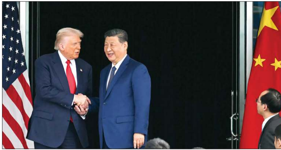
الرئيس الأميركي دونالد ترامب يودع نظيره الصيني شي جينينغ بعد اجتماعهما بقاعدة غينهاي الجوية في كوريا الجنوبية

النار، مشيرا إلى انه من المناسب أن تجري اختيبارا للأسلحة النووية مع قيام الآخرين بذلك، وسنحذر لاحقا مواقع التجارب النووية. من جهته، أعلن الرئيس الصيني أن بلاده توصلت إلى «توافق» مع الولايات المتحدة بشأن القضايا الاقتصادية والتجارية، بحسب ما نقلت عنه وكالة أنباء الصين الجديدة (شينخوا). وقال تبادلته الفرق التجارية والاقتصادية للمليدين وجهات النظر بشكل معمق بشأن القضايا الاقتصادية والتجارية المهمة، وتوصلت إلى توافق بشأن حلها». وقد أدلى بهذه التصريحات خلال اجتماعه مع ترامب على هامش مشاركتهم في الاجتماع الـ 32 للقادة الاقتصاديين المندى التعاون الاقتصادي لمنطقة آسيا والمحيط الهادئ (آبيك) في غونغجو، والولايات المتحدة تجنّب الانجرار إلى «حلقة مفرغة من الترتشيق بالإجراءات والإجراءات المضادة». ويعد انتهاء المحادثات، صافح ترامب نظيره الصيني ورافقه إلى سيارته قبل أن يغادر ترامب وسط احتفاء رسمي في المطار.