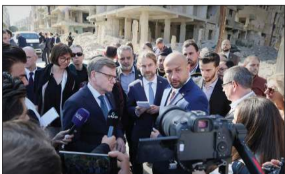
وزير الخارجية الألماني يوهان فايدفول خلال جولته في الاحياء المدمرة في حرسنا برفقة وزير الطوارئ راند الصالح

لألمانيا وأوروبا، ويمكن أن تصبح دولة ذات دور كبير في المنطقة ككل. وشدد على وحدة سورية واستقرارها وسيادتها، وتعمل على تقوية العلاقات معها. وأضاف «من واجبنا المساهمة في إعادة إعمار سورية ولدينا ثقة بالتوجه السوري الجديد». وتابع: «دعمنّا رفع العقوبات الاقتصادية عن سورية، ونشجع الشركات الألمانية على الاستثمار فيها، وسنستمر بتقديم الدعم للمنظمات الإنسانية والطبية».