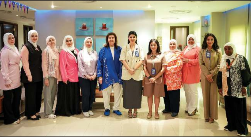
صورة جماعية للمشاركات في الحملة التوعوية

حيث تعد الحملات التي تطلقها العديد من المؤسسات التعليمية والتوعوية الصحية الأخرى تجسيدا عمليا لقيم البنك الراسخة والتزامه العميق بخدمة كل شرائح المجتمع. وبحفل سجل البنك الوطني بالعديد من المبادرات الريادية الاجتماعية والإنسانية التي تغطي مختلف المجالات، وتتضمن تلك المبادرات حملات توعوية وصحة ومكافحة الأمراض، وفي مقدمة هذه المبادرات الحملة السنوية لمكافحة سرطان الثدي والكشف المبكر عنه والسكري والبروستاتا وغيرها من الحملات الهادفة.