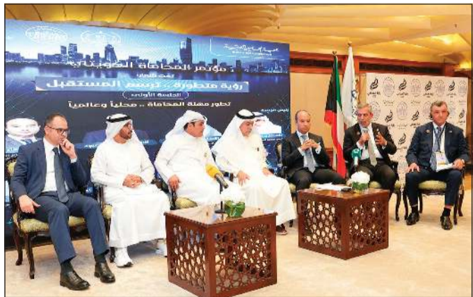
جانب من المشاركين في الجلسة الأولى بالمؤتمر

وروش العمل التي تناقش التحديات العامة للمحاميين والمهنة بشكل خاص». وبين أن فعاليات المؤتمر تتضمن أكثر من 12 ورشة عمل تغطي موضوعات عدة، منها: الذكاء الاصطناعي، آلية مرافعة المحامي، وأدبيات السلوك المهني، بمشاركة نخبة متميزة من المحامين المحليين والدوليين. واحتفاءً بانعقاد المؤتمر، نشرت جمعية المحامين الكويتية محضر اجتماع لجنة قيد المحامين الذي أقر تسجيل أول 12 محامياً في جدول المشتغلين بتاريخ 30 أكتوبر 1960، وهو اليوم الذي يحتفل به سنوياً كيوم للمحاميين الكويتيين، تخليداً لإطلاق مهنة المحاماة الرسمية في الكويت.