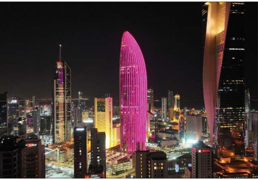
إضاءة مبنى البنك الوطني باللون الوردي