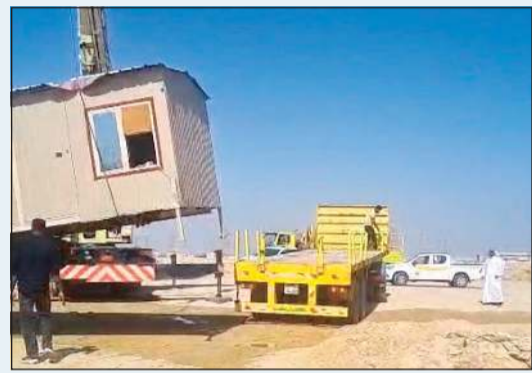
جانب من إزالة التعديلات