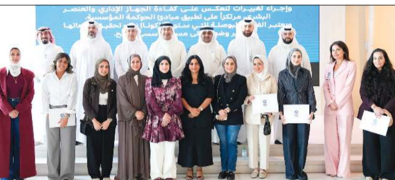
صورة جماعية للمشاركين في البرنامج التدريبي

كونا: اختتم مركز «كونا» لتطوير القدرات الإعلامية اليوم الخميس برنامج التدريب «الأساليب الحديثة في الإعلام والعلاقات العامة» الذي انطلق يوم الأحد الماضي بمشاركة عدد من منتسبي وكالة الأنباء الكويتية ووزارتي الداخلية والتجارة ومؤسسة الموانئ الكويتية والمجلس الأعلى للتخطيط والتنمية.