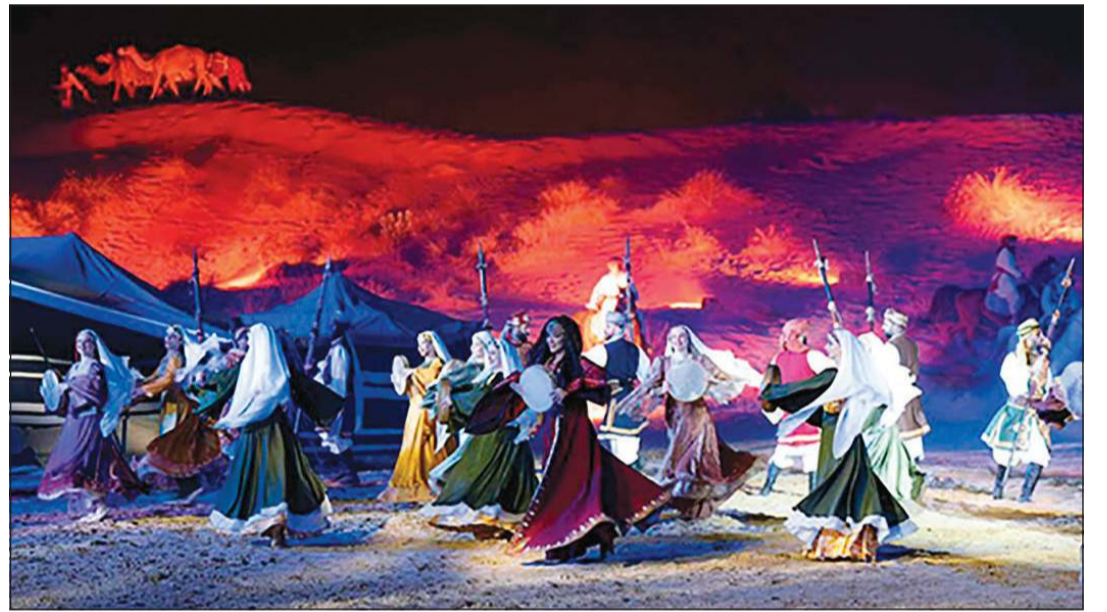
من عروض ليالي مهرجان الشارقة للمسرح الصحراوي السابقة

ومسرحية جديدة غير معهودة في الثقافة المسرحية العربية، وشكلت متنفسا خصبا لإبداعات عربية من فضاءات صحراوية خليجية وعربية متنوعة في أشكالها وأساليبها بعيدا عن الأطر التقليدية للمسرح، أو ما يعرف بـ«العيلة الإيطالية»، وهو بمنزلة رغبة من الشيخ سلطان بن محمد القاسمي، حاكم الشارقة، الذي دعا لتأسيسه بهدف استكشاف العلاقة بين المسرح والتراث الثقافي العربي، وتقديم عروض مسرحية تتميز بالمزج بين الأصالة والحداثة. والجميل في هذا المهرجان أن الشيخ سلطان القاسمي يكتب أعمالا خاصة به، ما يمنحه هوية مميزة وفريدة.