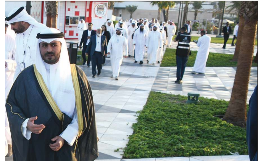
محافظ مبارك الكبير ومحافظ حولي بالتكليف الشيخ صباح بدر السالم أثناء افتتاح مشروع شاطئ المسيلة (بلاج 2)