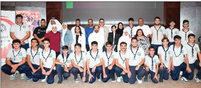
لقطة للمشاركة في ملتقى العائلات الصحي الخامس للأولمبياد الخاص

نظم الأولمبياد الخاص الكويتي ملتقى العائلات الصحي الخامس ضمن فعاليات البرنامج الصحي للأولمبياد الخاص للموسم 2025-2026 في مكتبة الكويت الوطنية، بحضور أم المعاقين الشيخة شبيخة العبدالله ورئيس مجلس إدارة الأولمبياد الخاص هناك الزاوي والمدير الوطني رحاب بورسلي ورئيس مجلس الأسر بالأولمبياد صديقة الأنصاري وعضو مجلس الأسر هدى الخالدي. وشهد الملتقى محاضرة علمية للدكتور عيسى المشوم حول «أهمية تحفيز الدماغ في الإعاقات المختلفة»، والتي استعرض فيها برامج تحفيز الدماغ للأشخاص ذوي الإعاقة الذهنية، من خلال أجهزة وتكنولوجيا متطورة لمساعدتهم في التغلب على المشكلات التي يمكن أن يعانون منها. وفي هذا الصدد، أشادت رحاب بورسلي بمستوى الطرح المميز والمعلومات القيمة والحديثة التي قدمها د.عيسى المشوم التي من شأنها تمكين أولياء الأمور والأسر في التعرف على وسائل علاج مبتكرة للعديد من المشاكل الصحية لأبنائهم من ذوي الإعاقة الذهنية ومختلف الإعاقات، وكذلك الأشخاص من غير ذوي الإعاقة، كما أعربت عن سعادتها بتجاوب