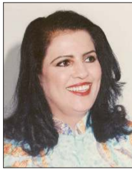
رئيسة لجنة التحكيم أحلام محمد

وقد أعلن خلال المؤتمر عن اختيار الفنان عبدالله يوسف شخصية الدورة، وتكريم كل من أمين صالح وأنور أحمد، بالإضافة إلى إعلان أسماء لجنة التحكيم التي ترأسها الفنانة القديرة أعلام محمد وعوضي عيسى الحمر، خالد الرويعي، خليفة زيمان، وأحمد جاسم، ويتضمن المهرجان العديد من الأنشطة المصاحبة التي تنظم ترسيخاً لمكانة البحرين كمنازل للمسرح والإبداع في المنطقة، واحتفاءً بمئوية المسرح البحريني.