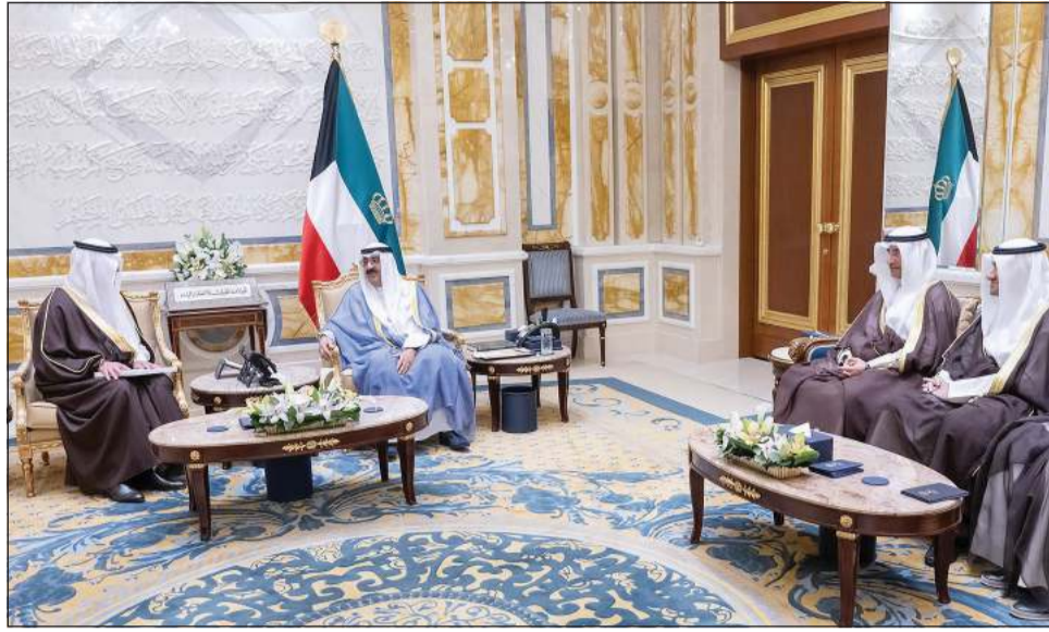
صاحب السمو الأمير مشعل الشيخ مشعل الأحمد مستقبلاً سفير خادم الحرمين صاحب السمو الأمير سلطان بن سعد بحضور مدير مكتب صاحب السمو الأمير الفريق م. جمال الذياب ووكيل الديوان الأميري الشيخ عبدالعزيز مشعل المبارك