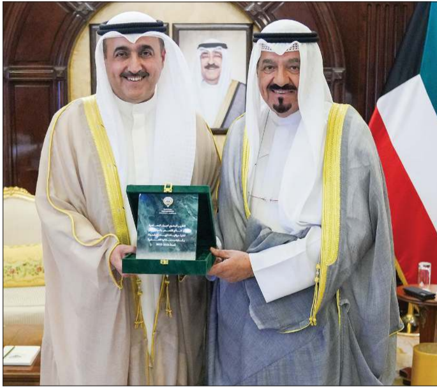
سمو الشيخ أحمد العبدالله رئيس الوزراء لدى تسلّم التقرير السنوي لديوان المحاسبة من رئيس الديوان عصام الرومي