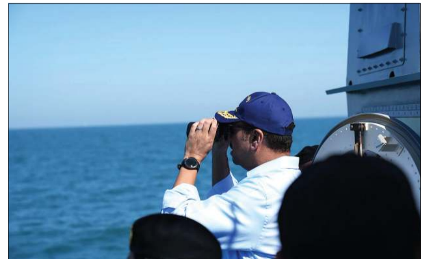
وزير الدفاع الشيخ عبدالله العلي يتابع تنفيذ رماية بالذخيرة الحية لدى زيارته إلى قاعدة محمد الأحمد البحرية

جاء ذلك خلال زيارته إلى قاعدة محمد الأحمد البحرية، والتي رافقه فيها رئيس الأركان العامة للجيش الفريق الركن خالد الشريعان، وكان في استقباله لدى وصوله أمر القوة البحرية اللواء الركن بحري سيف