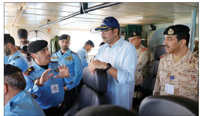
وزير الدفاع الشيخ عبدالله العلي مستمعاً إلى إيجاز من أمر القوة البحرية اللواء الركن بحري سيف الهمان عن بيان طبيعة الواجبات والمهام المؤكدة إلى القوة البحرية بحضور رئيس الأركان الفريق الركن خالد الشريعان

أكد وزير الدفاع الشيخ عبدالله العلي حرص القيادة السياسية على دعم القوات المسلحة ورفع كفاءتها وتعزيز جاهزيتها لمواجهة مختلف التحديات، معرباً عن اعتزازه بجهود منتسبي القوة البحرية وما يبذلونه من جهود مخلصّة وتفان في أداء واجبه الوطني.