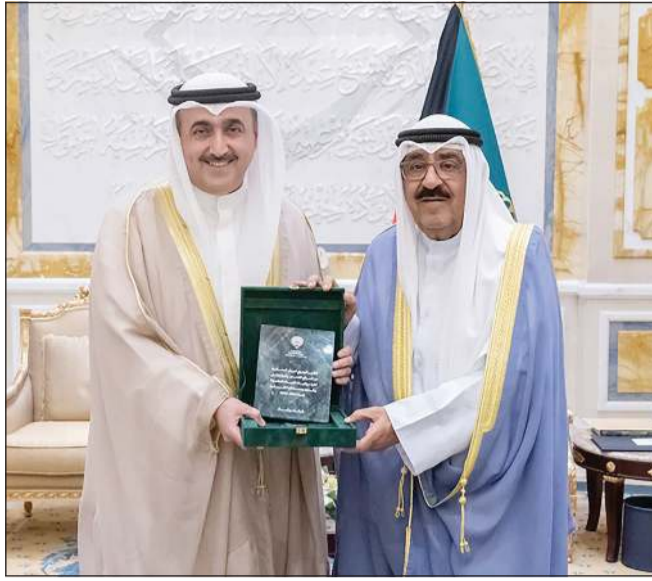
صاحب السمو الأمير مشعل الشيخ مشعل الأحمد لدى تسلّم التقرير السنوي لديوان المحاسبة من رئيس الديوان عصام الرومي