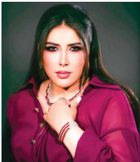
عبد الحميد الخطيب

من أن البطولات أصبحت نسائية، لافتة إلى أنها أخذت حقها في البطولة بعد سن الأربعين، على الرغم من أنها بدأت مشوارها الفني وهي في العشرينيات. من جانب آخر، أكدت عرفات أن العمر لا يشكل حاجسا لها، وقالت خلال استضافتها في برنامج «صباح العربية»: «الفنان ما له عمر»، فقما نحتاج في المسلسلات إلى الرضيع نحتاج أيضا إلى الجد والجددة، أنا أعرف عمري ولدي مرآة أشوف نفسي فيها، مستدركة: خلال أيام سأبلغ 56 عاما. أما عن الألقاب والجوائز، فقالت إنها كانت تهتم بها في بداياتها، لكنها اليوم لا تهتمها وتري أن قيمة الفنان في أعماله ورسائله للجمهور، مؤكدة أن إطلاق لقب «فنانة الخليج الأولى» عليها يظلم كثيرا من زميلاتي اللاتي لهن تأثيرهن في الساحة الفنية.