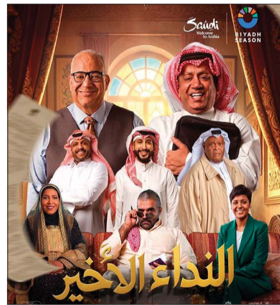
بوستر مسرحية «النداء الأخير»