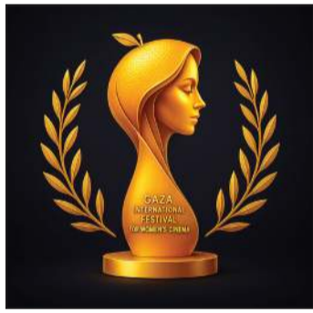
شعار مهرجان غزة الدولي لسينما المرأة