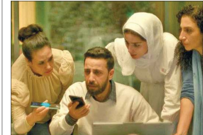
مشهد من فيلم «صوت هند رجب» للمخرجة التونسية كوثر بن هنية