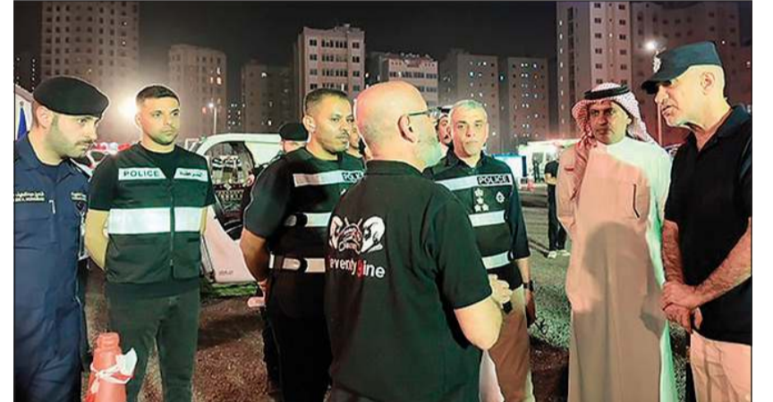
وجه النائب الأول لرئيس مجلس الوزراء ووزير الداخلية الشيخ فهد اليوسف فرق إطفاء مركز الشويخ الصناعية على حريق كراج وأخر يلتهم مزرعة مركبات

طبيعية و26 في قضايا آداب و4 حالات اشتباه وشخص واحد (تشبه بالجنس الآخر). كما شنت رجال شرطة النجدة حملة في منطقتي سلوى والرميثية أسفرت عن تحرير 524 مخالفة مرورية متنوعة وضبط مركبة مطلوبة وضبط شخصين صادر بحقهما أوامر إلقاء قبض و7 أشخاص بحوزتهم مواد مخدرة ومسكرة و5 أشخاص بحالة غير طبيعية و7