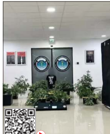
التهمة وأمامه المضبوطات

من مادة الماريغوانا الجاهزة، و50 غراماً من بذور الماريغوانا، و2 ميزان حساس يستخدم في تجهيز وتوزيع المادة المخدرة. وتبين أن المتهم يقوم بزراعة المادة المخدرة داخل بيئة مزودة بأجهزة إنارة وتهوية خاصة لتسريع عملية النمو، بهدف الاتجار والتعاطي في آن واحد، حيث تمت إحالته إلى جهة الاختصاص لاتخاذ الإجراءات القانونية اللازمة بحقه.