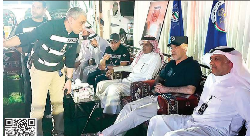
النائب الأول لرئيس مجلس الوزراء ووزير الداخلية الشيخ فهد اليوسف خلال الحملة الأمنية الشاملة في «المهولة»، يرافقه وكيل الوزارة المساعد لشؤون الأمن العام اللواء حامد الدواس