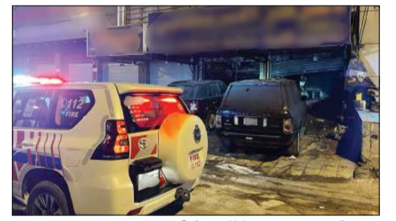
حريق الشويخ تسبب في إتلاف مركبة

سيطرت فرق إطفاء مركز الشويخ الصناعية على حريق كراج تصليح مركبات بمنطقة الري، هذا، وأسفر الحريق عن إصابة شخص وتضرر مركبتين على الأقل. من جهة أخرى، تعامل رجال مراكز الشقاييا والحرفي والقبروان والإسناد مع حريق مزرعة بمنطقة السالمي، حيث تمت مكافحة الحريق والسيطرة عليه دون وقوع أي إصابات تذكر.