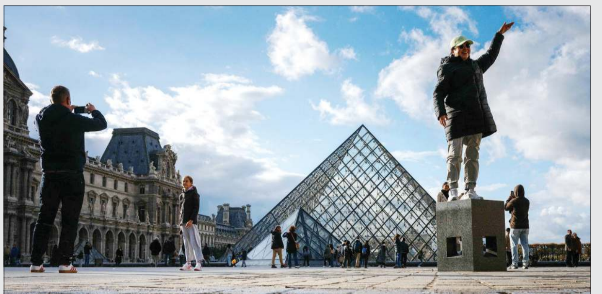
سياح يلتقطون صوراً تذكارية بعد إعادة اللوفر فتح أبوابه أمام الزوار

العربية.نت: بعد أن كشفت عملية سرقة جريئة في وضع النهار الأسبوع الماضي، عن هشاشة الوضع الأمني فيه، نقل متحف اللوفر بعضاً من أثمن مجوهراته إلى بنك فرنسا، وفق ما ذكرت إذاعة «آر.تي.إل» أمس. وأوضحت مصادر لم تسمها الإذاعة أن عملية نقل بعض القطع الثمينة من معرض أوبلو بالمتحف، الذي يضم جواهر تعود للحقبة الملكية، تمت أمس الأول بحراسة خاصة من الشرطة. ويقع بنك فرنسا، الذي يضم احتياطات البلاد من الذهب في قبو ضخم على عمق 27 متراً تحت الأرض، على بعد 500 متر فقط من متحف اللوفر، على الضفة اليمنى لنهر السين. يذكر أنه في 19 أكتوبر سرق لصوص 8 قطع ثمينة تقدر قيمتها بنحو 102 مليون دولار من مجموعة اللوفر.