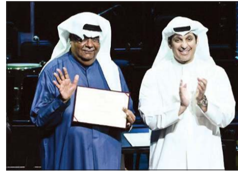
.. وتكريم الملحن أنور عبدالله