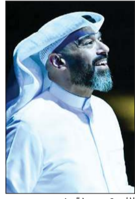
المايسترو د. خالد نوري

أقام المجلس الوطني للثقافة والفنون والآداب الجهة المنظمة لمهرجان الموسيقى الدولي الـ 25 معرضا مصورا يحاكي مسيرة الفنان القدير عبدالعزيز الفرج (شادي الخليج) تجول فيه وزير الإعلام والثقافة طويلا مع ضيوف الكويت، وذلك قبل الدخول إلى المسرح وشمل المعرض العديد من الصور النادرة والأخبار المنشورة عن شخصية المهرجان شادي الخليج منذ الستينيات وصولا إلى التسعينيات وما بعدها.