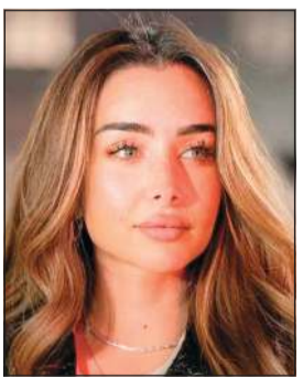
القاهرة - محمد صلاح

لطبيب نفسي مرة واحدة في حياتي، كنت عايزة أفهم الحالة دي كويس وأعيشها صح». وأردفت: «لازم أحسب خطواتي في شغلي وحياتي الشخصية، وحقيقي اختلفت عن زمان، بقيت أحسبها أكثر وحاسة إنني عقلت شوية في العامين الأخيرين». وأضافت أنها تعلمت الكثير من تجاربها السابقة.