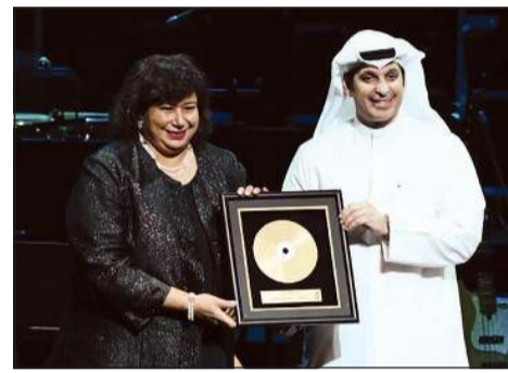
تكريم د. ايناس عبدالدايم