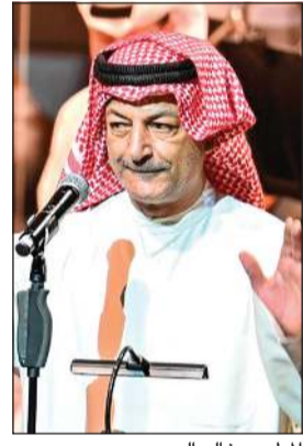
المطرب خالد العبيري