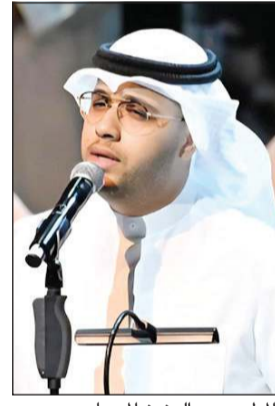
المطرب عبدالعزيز المسباح