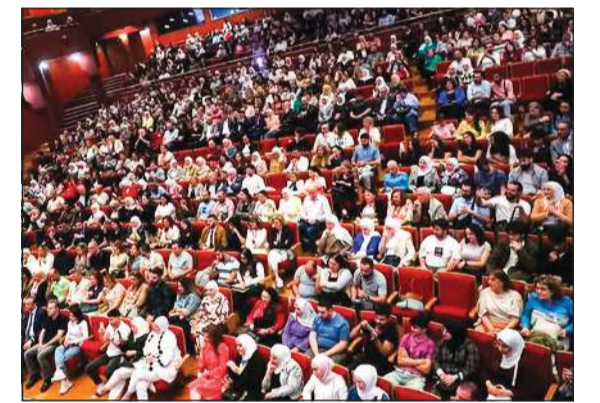
الحضور الكبير في دار الأوبرا بدمشق