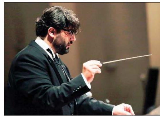
المايسترو عدنان فتح الله