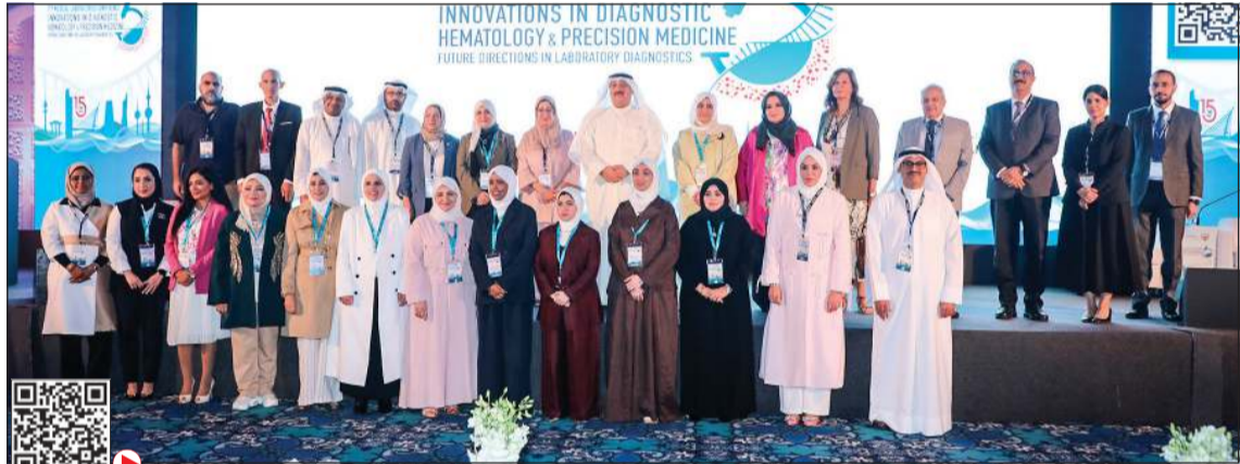
وزير الصحة د. أحمد العوضي متوسلاً المشاركين في المؤتمر

والجودة، حيث يعمل بها 67 طبيباً متخصصاً من بينهم 13 استشارياً، مشيرة إلى أن المختبرات أنجزت منذ بداية عام 2025 أكثر من 7,6 ملايين فحص لما يزيد على 3,1 ملايين عينة في المستشفيات العامة والمراكز التخصصية، إضافة إلى 712 ألف فحص في مراكز الرعاية الصحية الأولية. وأوضحت أن هذه الإنجازات جاءت نتيجة اعتماد أنظمة تقنية متقدمة خفضت الأخطاء البشرية إلى أدنى مستوياتها، إذ بلغت نسبة العينات المرفوضة 0,38٪ فقط خلال عام 2025، كما تم إدخال فحوصات متطورة مثل فحص الأنيميا المنجلية الكمية والعمل الثامن الكروموجيني والفحوصات الجينية الدقيقة. وأكدت الجمعية أن سرعة ظهور النتائج المخبرية تحسنت بشكل ملحوظ، إذ انخفضت نسبة الفحوصات التي تتجاوز 60 دقيقة من 15٪ إلى 9٪، مما يعكس الطابع الدولي للمؤتمر وغناؤه العلمي وتنوع الخبرات المشاركة. وأضافت أن مختبرات أمراض الدم في الكويت تشهد نقلة نوعية في الأداء التشخيصي.