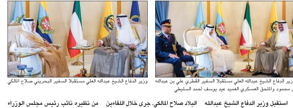
وزير الدفاع الشيخ عبدالله العلي مستقبلاً السفير القطري علي بن عبدالله آل محمود والملحق العسكري العميد عيد يوسف أحمد السليطي

التي سيبدأ العمل بها رسمياً في الأول من نوفمبر المقبل تمثل البوابة الرقمية الرسمية الموحدة لترخيص وتنظيم الفعاليات في الكويت وتأتي ترجمة لاستراتيجية الإعلام في تطبيق التحول الرقمي في إدارة القطاعات الحيوية بما يضمن الكفاءة والشفافية وسرعة الإنجاز. ولفت إلى أن «فيزت كويت» تشكل أداة استراتيجية لدعم التنمية الثقافية والسياحية في البلاد