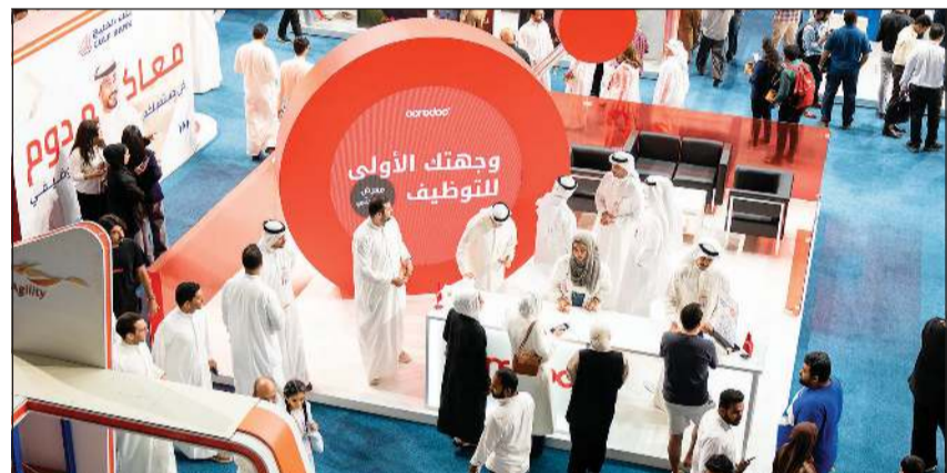
جناح Ooredoo الكويت في معرض وظيفتي