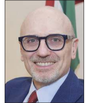
السفير الإيطالي لورينزو موريني

سيشهد افتتاح صالة عرض جديدة لتصاميم «بولتورنا فراو» الإيطالية بالتعاون مع (CAP)، حيث سيقيم عدد من المصممين الإيطاليين بإلقاء محاضرات في جامعة الكويت والمنصة نفسها لتعزيز التبادل المهني والثقافي بين المعماريين والمصممين من البلدين. أما فيما يتعلق بيوم الافتتاح 19 أكتوبر، فسيحفل حفل موسيقي كلاسيكي في المركز الثقافي الأميركي، بعد أن نقل من موقعه الأصلي في دار الآثار الإسلامية بسبب إغلاق الطرق، مشيدا بالموقع الجديد الذي يتميز بأجوائه الراقية، مضيفا: «سيحتضن الحفل موسيقى كلاسيكية من أشهر أفلام السينما الإيطالية، من تأليف كبار الموسيقيين مثل إنيو موركوني، تتضمن مقاطع من أفلام شهيرة مثل «العراق» و«حدث ذات مرة في الغرب» و«سينما باراديسو» وأعمال المخرج فيليني. وفي سياق العلاقات الثنائية، أكد السفير أن العلاقات بين إيطاليا والكويت ممتازة وتشهد تطورا متواصلا، مشيرا إلى أن البلدين يعملان حاليا على التحضير لعدد من الزيارات رفيعة المستوى خلال الأشهر المقبلة، معربا عن الأمل في أن يشهد القريب العاجل تبادلًا للزيارات بين القيادات في البلدين. وأضاف أن التعاون الثنائي يشمل مجالات متعددة مثل الاستثمار والدفاع والعلوم والأمن والتدريب، إلى جانب بحث سبل توسيع الرحلات الجوية المباشرة بين البلدين، موضحا