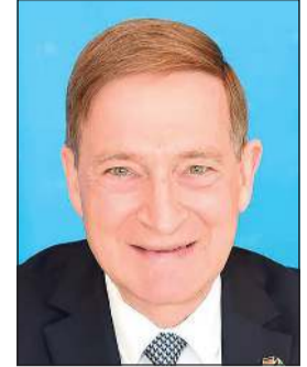
السفير الألماني هانس كريستيان فريهيجر

أهمية التعاون في مجالي الأمن والدفاع وإقامة دورات تقدمها المؤسسات العسكرية في البلدين