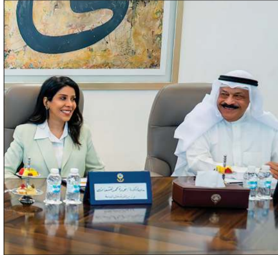
رئيس ديوان رئيس مجلس الوزراء عبدالعزيز الدخيل ووزيرة الأشغال العامة د.نورة المشعان