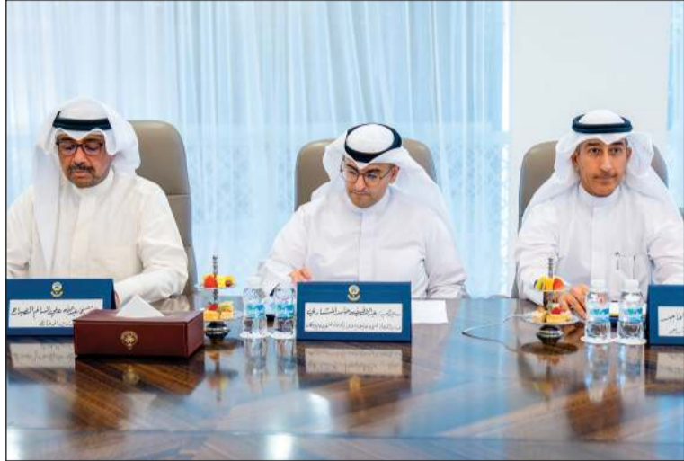
وزير الدفاع الشيخ عبدالله العلي ووزير الدولة لشؤون البلدية ووزير الدولة لشؤون الإسكان عبداللطيف المشاري ورئيس إدارة الفتوى والتشريع المستشار صلاح الماجد