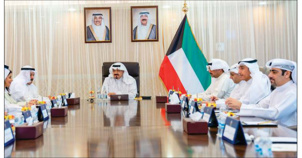
سمو الشيخ أحمد عبدالله رئيس مجلس الوزراء مترأساً اجتماع اللجنة الوزارية لمتابعة الموقف التنفيذي للاتفاقيات ومذكرات التفاهم الموقعة بين الكويت والصين