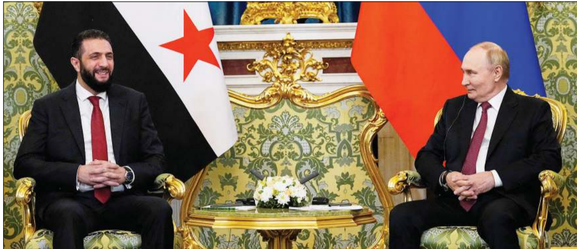
الرئيس الروسي فلاديمير بوتين مستقبلاً نظيره السوري أحمد الشرع في القصر الرئاسي «الكرملين»

عواصم - وكالات: استقبل الرئيس الروسي فلاديمير بوتين نظيره السوري أحمد الشرع في القصر الرئاسي «الكرملين»، لأول مرة منذ الاطاحة بنظام الرئيس بشار الاسد في ديسمبر الماضي. وذكرت وكالة الأنباء السورية «سانا» انه جرى خلال اللقاء بحث العلاقات الثنائية بين البلدين، وسبل تعزيز التعاون الاستراتيجي في مختلف المجالات. وقال بوتين للشرع لدى استقباله في الكرملين في اجتماع استمر لأكثر من ساعتين ونصف: نريد مصلحة الشعب السوري، وأن العلاقات الروسية - السورية علاقات صداقة ولم تكن لروسيا أي مصالح منوطة بالحالة السياسية أو المصالح الخاصة وهي مرتبطة بالمصالح المتبادلة ومصلحة الشعب السوري. وأضاف: «أرحب بالرئيس أحمد الشرع ولدينا علاقات قوية مع سورية منذ أكثر من 80 عاماً». واعتبر بوتين أن الانتخابات البرلمانية في سورية نجاح كبير وستعزز الروابط بين القوى السياسية كافة.