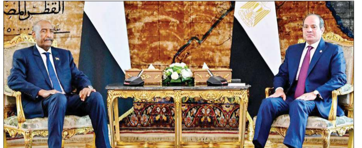
الرئيس المصري عبدالفتاح السيسي مستقبلاً رئيس مجلس السيادة الانتقالي في السودان الفريق أول ركن عبدالفتاح البرهان