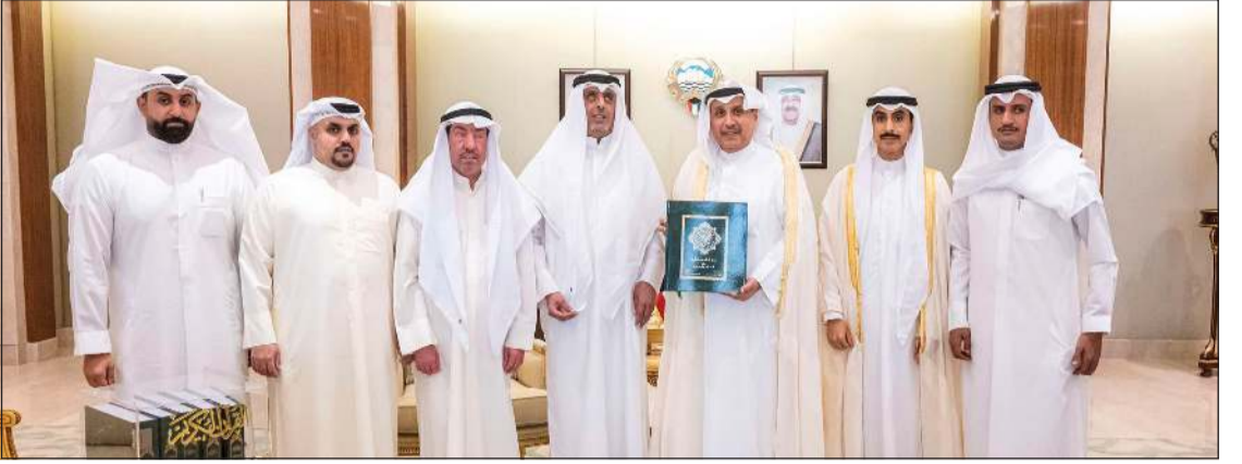
وزير شؤون الديوان الأميري الشيخ حمد جابر العلي ورئيس ديوان سمو ولي العهد الشيخ ثامر جابر الأحمد في لقطة جماعية المكفوفين فايز العازمي وأعضاء مجلس الإدارة في لقطة جماعية

تسخير كل الإمكانيات لتمكينهم واندماجهم الكامل بالمجتمع ضمن رؤية الدولة لحقوق ذوي الإعاقة ورعايتهم