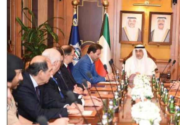
النائب الأول لرئيس الوزراء ووزير الداخلية الشيخ فهد اليوسف مع سفراء مجموعة دول أميركا اللاتينية والكاريبية

مختلف المجالات ذات الاهتمام المشترك. من جانبهم، عبر السفراء عن تقديرهم للنائب الأول على باهتمام الكويت بتعزيز العلاقات مع الدول الشقيقة والصديقة، وبما يخدم المصالح المشتركة ويساهم في توطيد أواصر التعاون بين الجانبين.