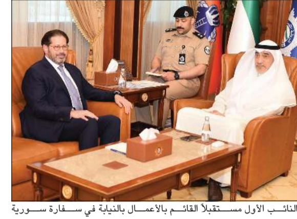
النائب الأول لرئيس الوزراء ووزير الداخلية الشيخ فهد اليوسف مستقبلا السفير الأردني سنان المجالي

اليوسف اجتمع مع سفراء مجموعة دول أميركا اللاتينية والكاريبية في إطار تعزيز علاقات الصداقة