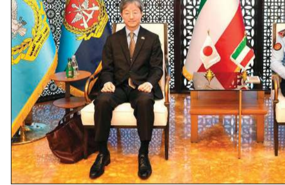
رئيس الأركان الفريق الركن خالد الشريعان مستقبلا السفير الياباني كينيتشيرو موكاي

الكويت ساهمت في نقل 1500 مقاتل من الإرهابيين الأجانب وذويهم من شمال شرق سورية إلى بلادهم