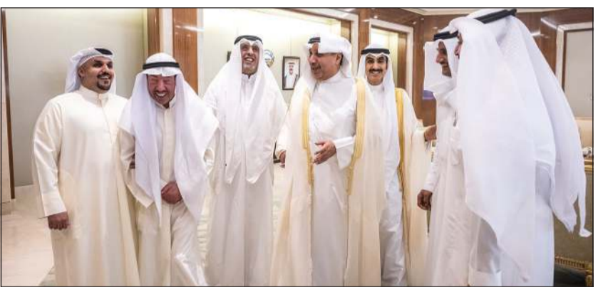
وزير شؤون الديوان الأميري الشيخ حمد جابر العلي ورئيس ديوان سمو ولي العهد الشيخ ثامر جابر الأحمد لدى استقبال رئيس وأعضاء مجلس إدارة «المكفوفين»

كونا: استقبل وزير شؤون الديوان الأميري الشيخ حمد جابر العلي، ورئيس ديوان سمو ولي العهد الشيخ ثامر جابر الأحمد بقصر بيان رئيس مجلس إدارة جمعية المكفوفين الكويتية فايز لافي العازمي، وأعضاء مجلس الإدارة حيث قدموا التهنئة لهما بمناسبة تعيينهما في منصبيهما الجديدين. وأكد وزير شؤون الديوان الأميري الشيخ حمد جابر العلي حرص القيادة السياسية الرشيدة على دعم فئة المكفوفين وتذليل العقبات التي قد تعترض طريقهم وتسخير كل الإمكانيات التي تكفل تمكينهم واندماجهم الكامل في المجتمع وذلك ضمن رؤية الدولة لحقوق ذوي الإعاقة ورعايتهم.