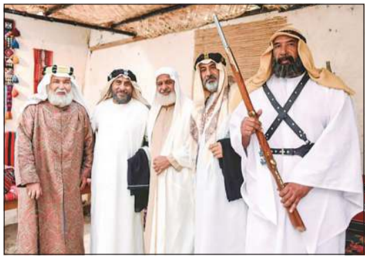
العمل التاريخي «الطبعة»