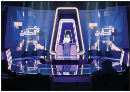
برنامج «مع الطلبة» بحلته الجديدة

تشهد عودة «مع الطلبة» و«6/6».. و«صباح الخير» و«مساء الخير» برؤية مغايرة