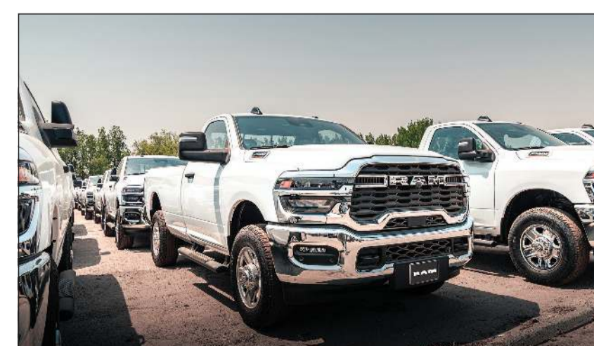
شاحنات رام HEAVY DUTY 2500

دعم مسيرة التنمية الوطنية وتلبية متطلبات عملائنا في مختلف المجالات. وتؤكد هذه الخطوة حرص شركة الملا وبهبهاني على مواصلة دورها كشريك استراتيجي للقطاعات الحيوية في الكويت، من خلال توفير أحدث المركبات