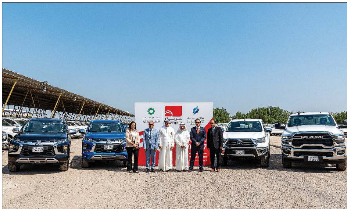
ممثلو إدارة «عربة» وإدارة الحركة لوزارة الكهرباء والماء أثناء تسليم السيارات

العملاء الحكومية والعمليات في منطقة عربة بتسليم السيارات في منطقة إدارة الحركة لوزارة الكهرباء والماء. بحضور الفريق الإداري المختص من وزارة الكهرباء والماء. ولطالما وضعت رضا عملائها في مقدمة أولوياتها، حيث تقدم لهم حلول نقل مصممة لاحتياجاتهم على المستويين التجاري والشخصي، مدعومة بمجموعة من الخدمات التشغيلية ومزايا التاجير المختلفة، عبر شبكة قوية من مراكز الخدمة والصيانة، والتي تتم إدارتها بطواقم عالية التدريب والأداء.