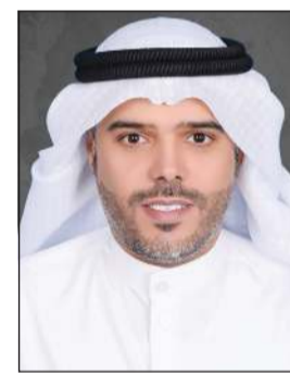
د. خالد العجمي

إعداد واعتماد هيكله التنظيمي مباشر من وزير الشؤون الاجتماعية وشؤون الأسرة والطفولة. وأضاف أن عملية التسكين تتم وفقاً لمنظومة إدارية دقيقة، تراعي العدالة وتكافؤ الفرص والارتقاء بالكوادر الوطنية، لافتاً إلى أن الهيكل الجديد يعد خطوة أساسية نحو تحقيق التحول المؤسسي الرقمي الكامل للوزارة، بما يضمن تقديم خدمات اجتماعية أكثر فاعلية وجودة للمستفيدين. واختتم العجمي تصريحه بالتأكيد أن وزارة الشؤون تسير بخطى متسارعة نحو تعزيز كفاءتها التشغيلية وتنويع مواردها المالية، بما يتماشى مع رؤية الكويت 2035، ويترجم توجهات الدولة نحو تمكين المؤسسات الحكومية من الاعتماد على أدوات تمويل وتنمية مستدامة.