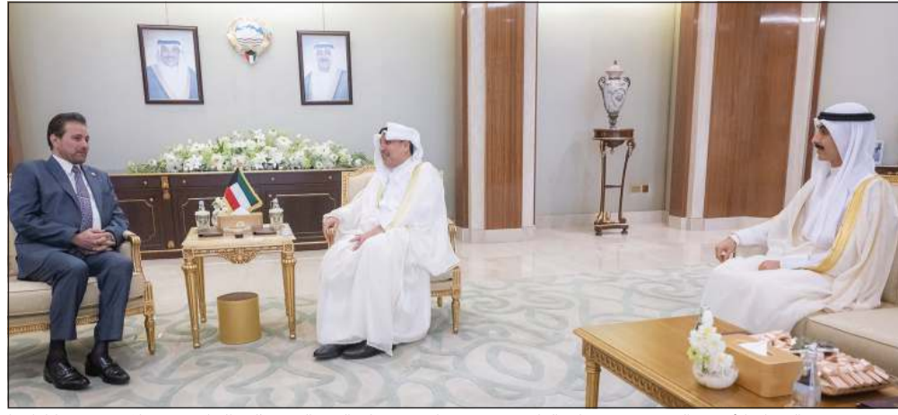
وزير شؤون الديوان الأميري الشيخ حمد جابر العلي ورئيس ديوان سمو ولي العهد الشيخ ثامر الجابر يستقبلان سفير نيكاراغوا لدى الكويت محمد المختار محمد عبدالسلام فرارة

كونا: استقبل وزير شؤون الديوان الأميري الشيخ حمد جابر العلي ورئيس ديوان سمو ولي العهد الشيخ ثامر الجابر بقصر بيان صباح أمس رئيس البعثة الإقليمية للجنة الدولية للصليب الأحمر لدول مجلس التعاون الخليجي لدى دولة الكويت مامو صو الذي قدم التهانئتين لهما بمناسبة تعيينهما في منصبيهما الجديدين. وجرى خلال اللقاء استعراض بعض الأعمال الإنسانية التاريخية، حيث أكد وزير شؤون الديوان الأميري على أهمية استقلال العمل الإنساني عن السياسة في بعثات اللجنة بما يخدم المبادئ السامية إقليمياً ودولياً ومساعدتها الإنسانية، مشيراً إلى استمرارية دولة الكويت