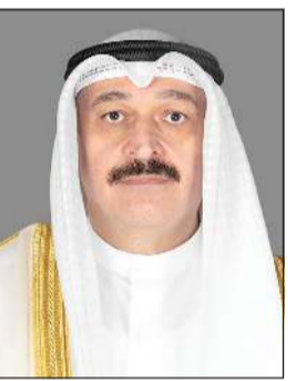
وزير الصحة د. أحمد العوضي

مرض الزهايمر والصداق النصفي والإفولوزا. كما تضمنت القرار إلغاء عدد من الأدوية القديمة التي جرى استبدالها بأخرى أكثر فاعلية وأقل كلفة، ليصل العدد الإجمالي للأدوية والمستحضرات المعتمدة خلال عام واحد فقط إلى 1580 دواءً ومكمل غذائي تم تسعيرها أو مراجعتها في الكويت، في دلالة واضحة على النشاط المؤسسي المكثف الذي تشهده الرقابة الدوائية في البلاد. وأكدت وزارة الصحة أن منظومة التسعير الجديدة تستند إلى أسعار مرجعية خليجية وعالمية، وتخضع للمراجعة الدورية عبر لجان فنية متخصصة تتابع تطورات الأسواق العالمية وتحرص على تحقيق الموازنة في الأسعار. وقالت الوزارة إن هذا النهج يهدف إلى ضمان توافر الدواء بأسعار مبرورة دون الإخلال بمعايير الجودة