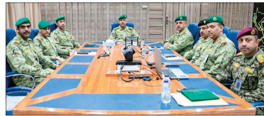
الفريق الركن حمد البرجس مع عدد من القيادات خلال زيارة معسكر الصمود

قام وكيل الحرس الوطني الفريق الركن حمد البرجس بجولة تفقدية في معسكر الصمود شملت لواء المشاة الأولى، ولواء الأمن الداخلي، ومديرية الإسناد القتالي، وكان في استقباله قائد لواء التعزيز العبد الركن عبدالله صالح عبدالله، ونقل وكيل الحرس الوطني للمنتسبين تحيات قيادة الحرس الوطني ممثلة في الشيخ مبارك الصمود رئيس الحرس الوطني، والشيخ فيصل النواف نائب رئيس الحرس، واستمع في مركز عمليات الإسناد القتالي إلى إيجاز عن الوحدات اشتمل على القدرات