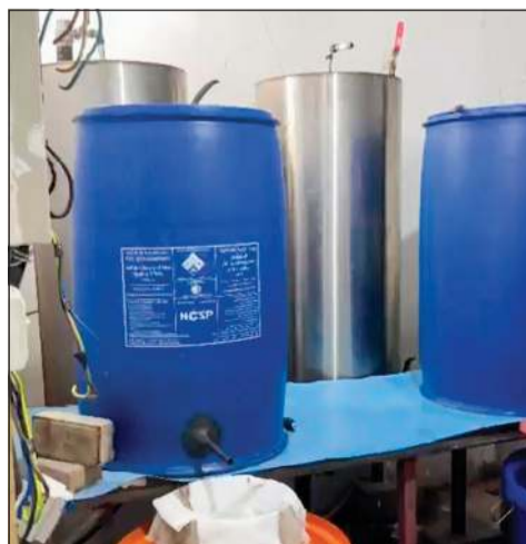
المضبوطات من داخل المصنع