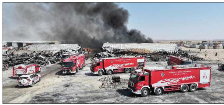
آليات الإطفاء في موقع حريق المخزن

ولاحظت سلامة والوقاية من الحريق. وقد أسفرت الحملة عن تحرير عدد (61) من الإخطارات والإنذارات لعدد من المنشآت والمحلات، وذلك بسبب عدم استيفائها لاشتراطات الخاصة بقوة الإطفاء العام.