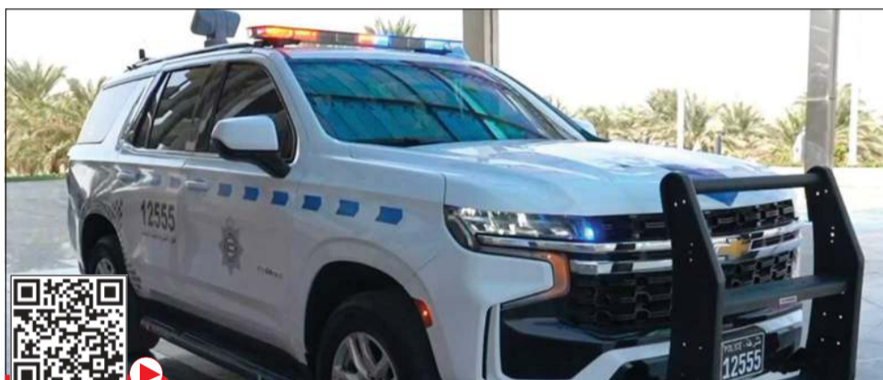
الدورية الذكية مزودة بأنظمة حديثة منها كاميرات ذكية متحركة تتعرف على الوجوه

وأكدت وزارة الداخلية أنها ماضية في تطوير المنظومة الأمنية وتوظيف أحدث التقنيات لخدمة الأمن العام، بما يساهم في تعزيز الأمن والاستقرار في البلاد.