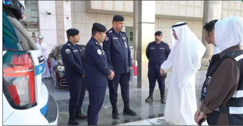
النائب الأول لرئيس مجلس الوزراء ووزير الداخلية الشيخ فهد اليوسف خلال زيارته قطاع الموارد البشرية وتقنية المعلومات للاطلاع على الدورية الذكية