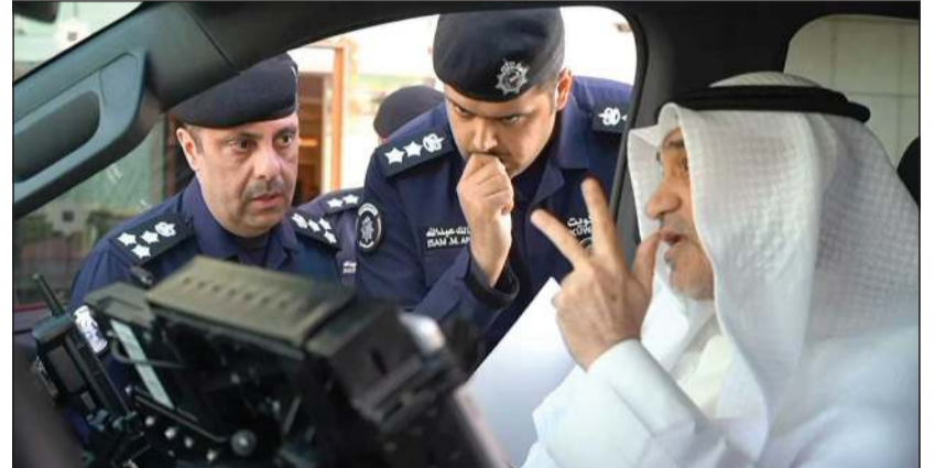
النائب الأول لرئيس مجلس الوزراء ووزير الداخلية الشيخ فهد اليوسف يتابع كيفية عمل الدورية الأمنية الذكية

الإلكتروني. وتضم الدورية منظومة متكاملة من التقنيات الحديثة، من بينها كاميرات ذكية متحركة متصلة بأنظمة التعرف على الوجوه ولوحات المركبات، وجهاز بصمة متقل للتعرف الفوري على هوية الأشخاص، بالإضافة إلى أنظمة ربط مباشر مع قواعد بيانات وزارة الداخلية لسرعة التعرف على المطلوبين والمركبات بشكل لحظي، وأنظمة ذكاء اصطناعي لمعالجة وتحليل الصور مباشرة بما يدعم رجال الأمن في الميدان ويعزز سرعة ودقة الإجراءات الأمنية.