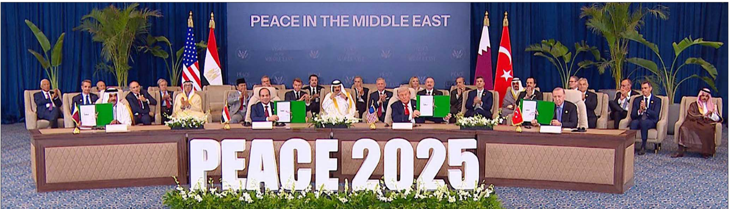
الرئيس الأميركي دونالد ترامب والرئيس المصري عبدالفتاح السيسي وصاحب السمو الشيخ تميم بن حمد أمير دولة قطر والرئيس التركي رجب طيب أردوغان بعد توقيع اتفاق إنهاء الحرب في غزة خلال قمة شرم الشيخ للسلام

ترامب: لا حرب عالمية ثالثة في الشرق الأوسط والآن بدأنا إعادة إعمار غزة