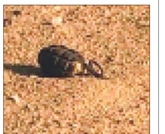
قنبلية من مخلفات الغزو

قنبلية يدوية من مخلفات الغزو في «السالمي»