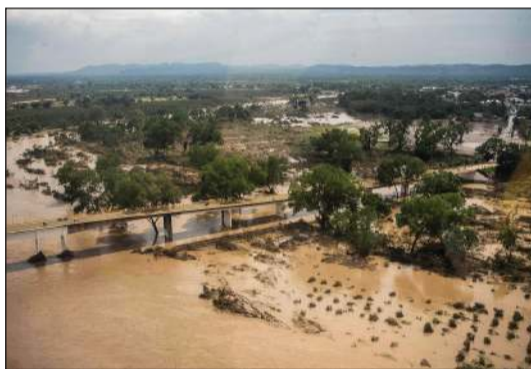
صورة جوية لفيضان نهر كازونز الذي غمر منطقة بوزا ريسا في فيرا المكسيكية

هيدالغو - أ.ف.ب: أودت فيضانات ناجمة عن أمطار غزيرة هذا الأسبوع في المكسيك بحياة 41 شخصاً على الأقل وخلفت أضراراً كبيرة وأعداداً من المنكوبين، حسبما أعلنت السلطات المحلية.