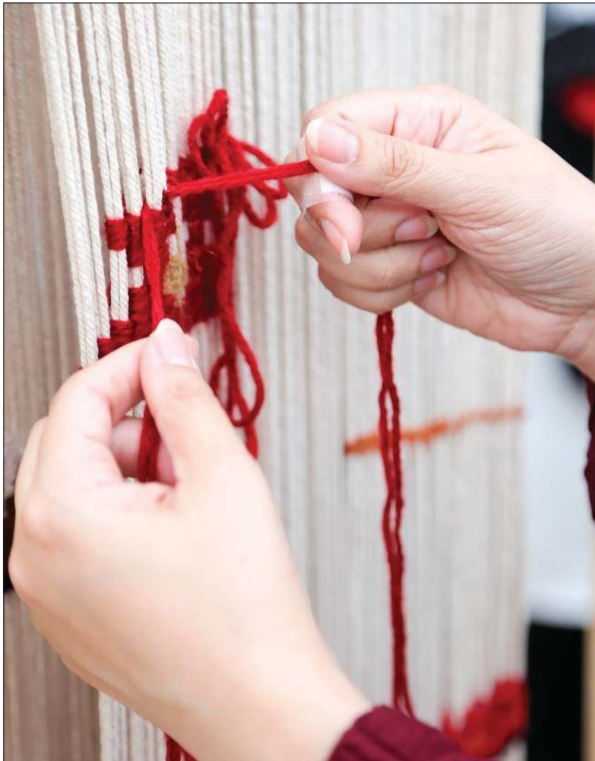
جانب من العرض الحي لفن السدو في جناح الكويت